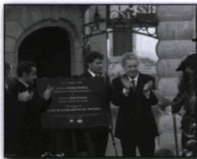
Inauguration du Centre de la francophonie des Amériques, le 17 octobre 2008, par le président de la République, Nicolas Sarkozy, et le premier ministre du Québec, Jean Charest.

la capitale, la France a offert au Québec l'aménagement architectural des espaces publics du nouveau Centre de la francophonie des Amériques dont la mission est de favoriser et de promouvoir la culture francophone sur le continent américain.