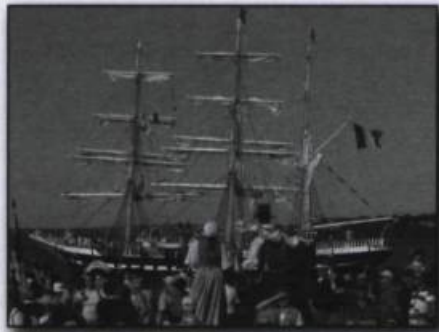
Arrivée du plus vieux trois-mâts français, le Belem , le 2 juillet 2008, dans le port de Québec.

La présence française au Québec est susceptible de s'accroître, à la suite de la signature par le président de