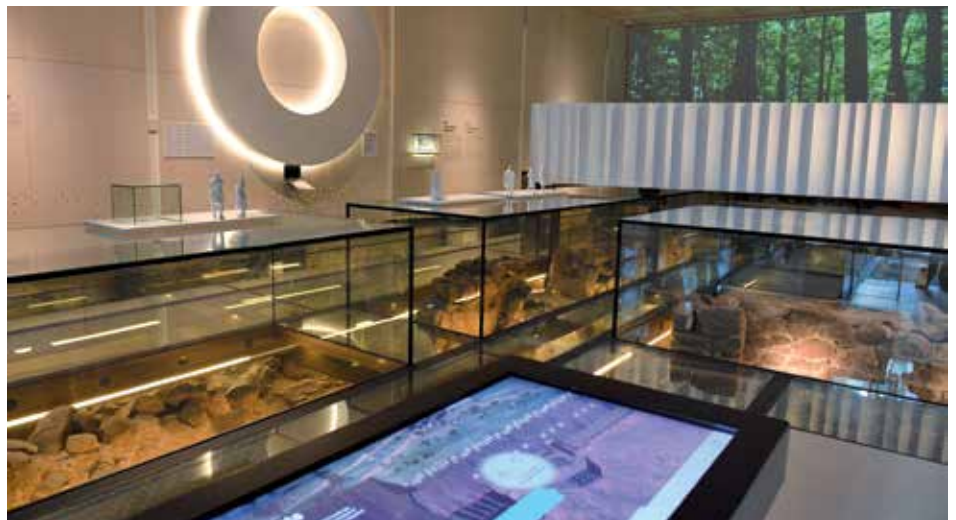
Dans le nouveau pavillon de Pointe-à-Callière, on peut voir les vestiges du fort sous un plancher de verre.

En 2002, le musée met sur pied, en partenariat avec l'Université de Montréal, une première école de fouilles d'archéologie historique en milieu urbain, à la recherche des vestiges du fort. Par la suite, chaque printemps, des étudiants explorent le site, suivis des archéologues de la firme Ethnoscop en 2015 et 2016. Ils y découvrent des vestiges ainsi que plusieurs milliers d'artéfacts et d'écofactes (comme des ossements d'animaux, des graines ou des restes de nourriture). Parmi les objets anciens, ils déterrent notamment un cadran solaire gravé sur une