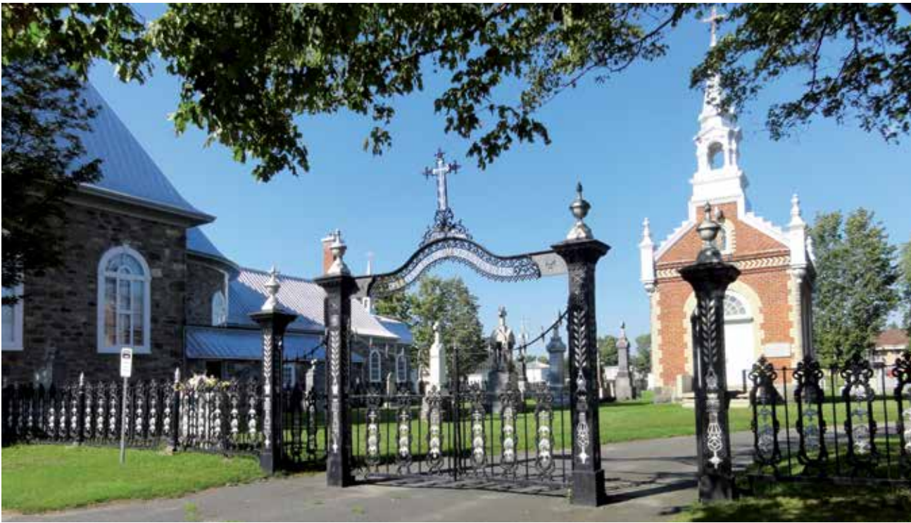
Au cimetière de Saint-Anselme, dans Bellechasse, on peut admirer une chapelle de style néogothique ainsi qu'un portail et une clôture très élaborés, réalisés par une fonderie locale.