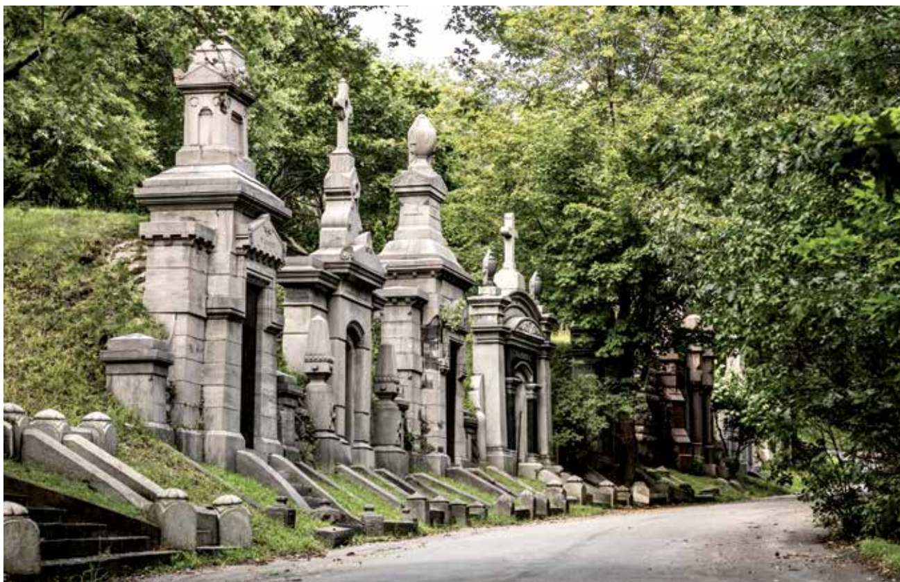
De toute beauté, cette enfilade de caveaux au cimetière Notre-Dame-des-Neiges ! Pourtant, Alain Tremblay, de l'Écomusée de l'Au-Delà, s'inquiète de la détérioration de certains d'entre eux.