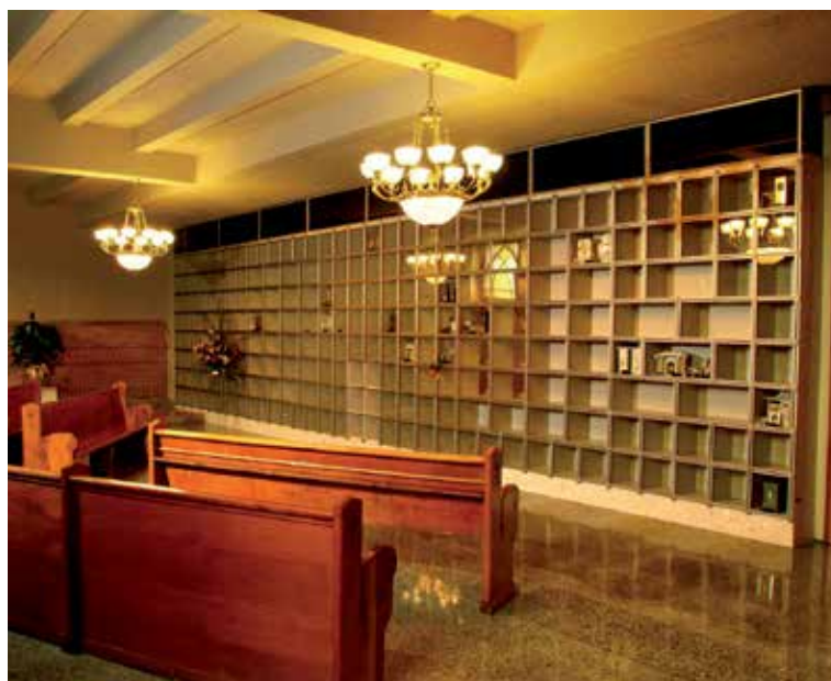
Menacée de fermeture il y a quelques années, l'église Saint-Joseph à Drummondville poursuit ses activités grâce à l'aménagement, dans son enceinte, d'un salon funéraire avec columbarium.

Cette meilleure adaptation pourrait même contribuer à la conservation des églises patrimoniales en péril si on y aménageait des columbariums, avance-t-il. « Il n'est pas question d'encombrer les églises avec des morts, mais j'ai suggéré de prévoir des fonctions funéraires dans l'église Saint-Eusèbe-de-Vercueil du quartier Centre-Sud, à Montréal. Elle est menacée de démolition. L'endroit pourrait être partagé avec des organismes communautaires qui en assureraient la surveillance. Ça