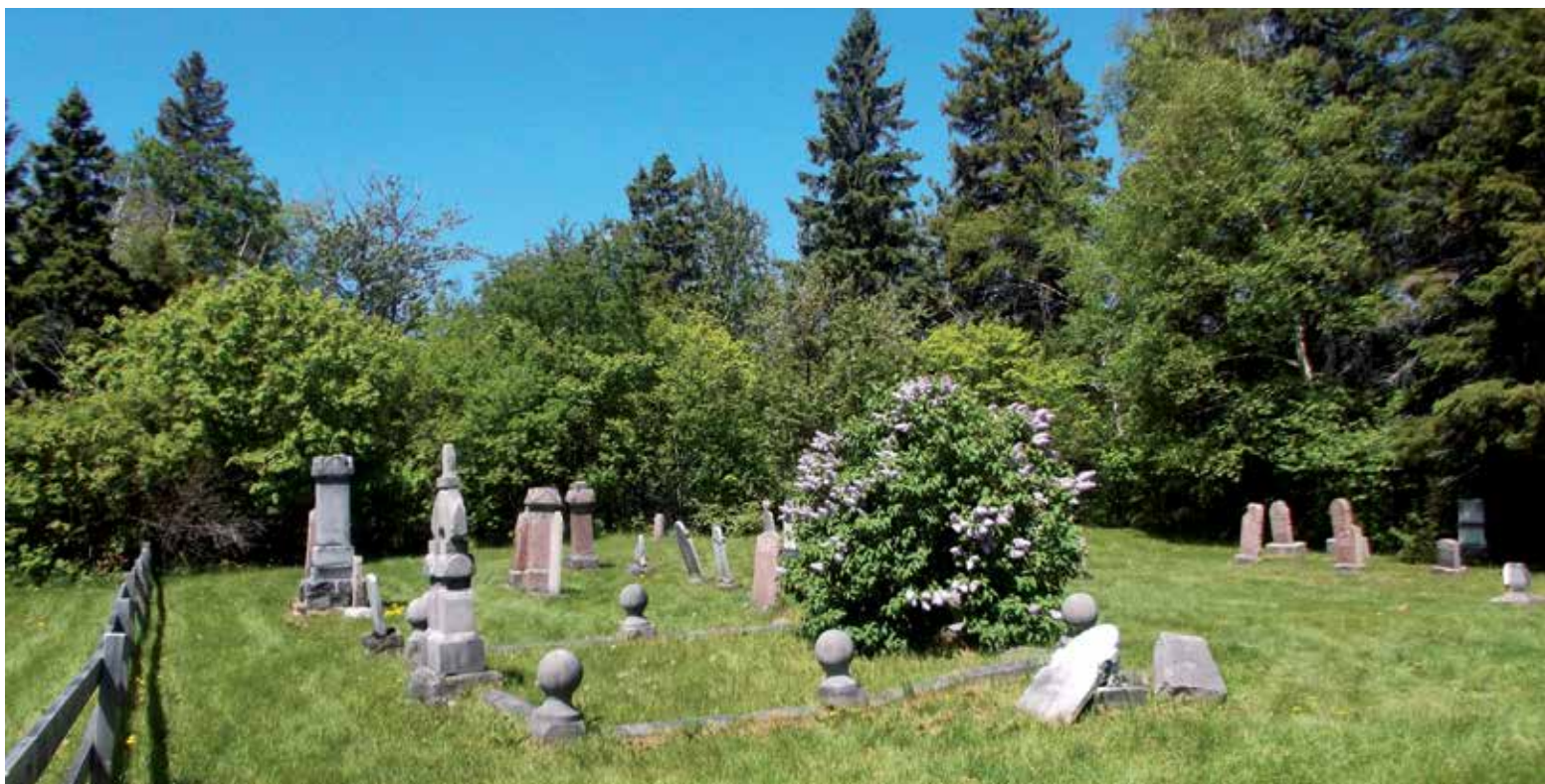
Le cimetière de Saint-Georges-de-la-Ouïatchouan fait partie des lieux de sépulture classés par le gouvernement du Québec puisqu'il se situe dans le site patrimonial du Village historique de Val-Jalbert.