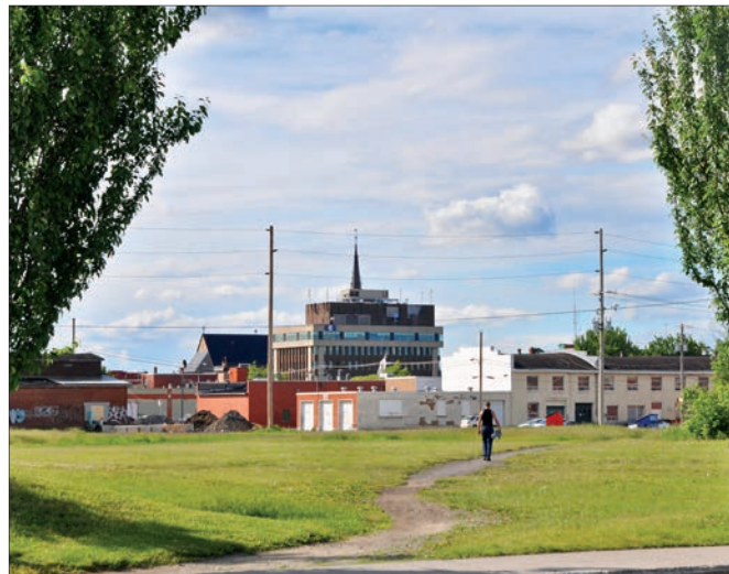
Une des solutions proposées pour revitaliser les sites industriels : aménager des sentiers piétonniers à partir des sentiers informels qui se trouvent sur les terrains vacants de l'ancienne gare de triage.