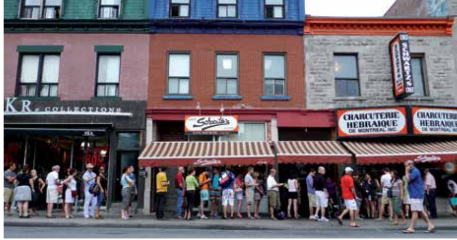
Issu de l'immigration juive d'Europe de l'Est, le smoked meat Schwartz's fait partie des incontournables montréalais.

Jeanne Corriveau est journaliste au quotidien Le Devoir .