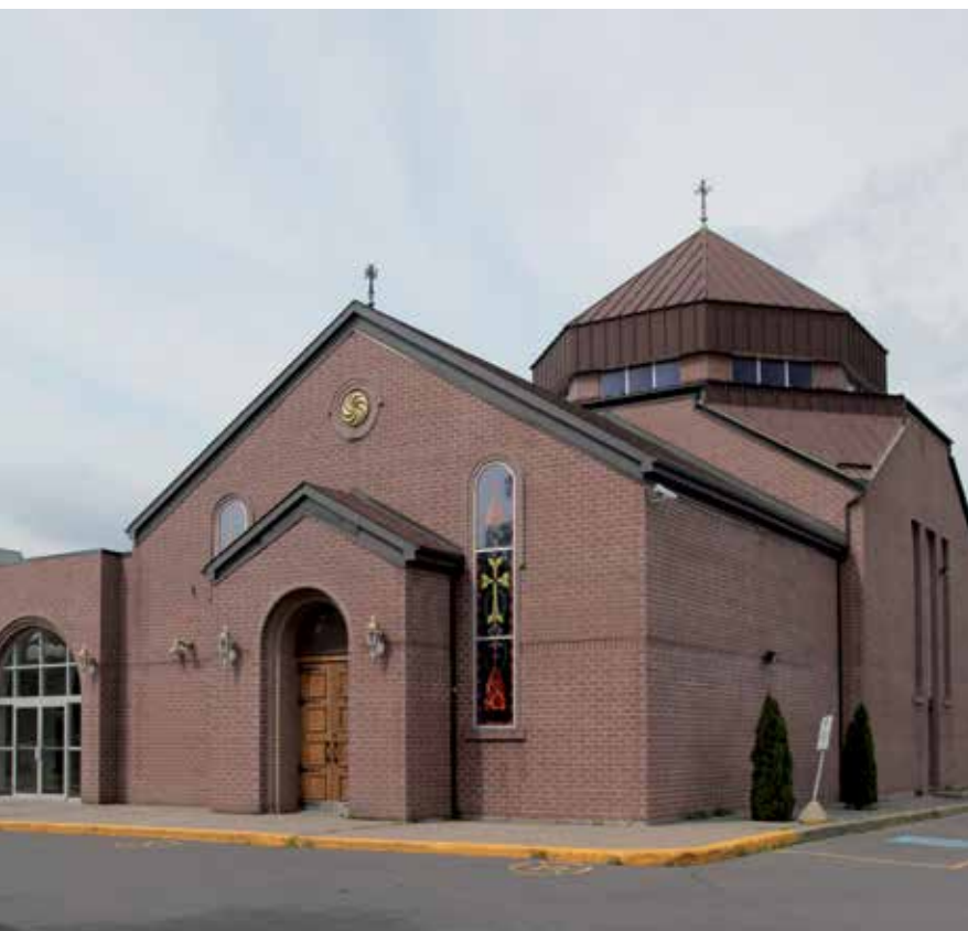
Conçue par l'architecte Dikran Gabriel et construite entre 1969 et 1973, l'église apostolique arménienne Sourp Hagop témoigne de la présence de cette communauté dans l'arrondissement d'Ahuntsic-Cartierville, à Montréal.