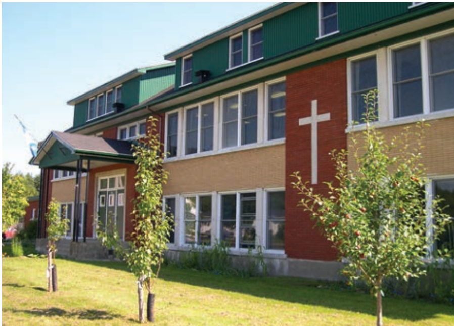
Afin d'éviter la fermeture de l'école de Saint-Joachim, des intervenants se sont unis pour mettre en place une école internationale, devenue depuis un élément identitaire du village.