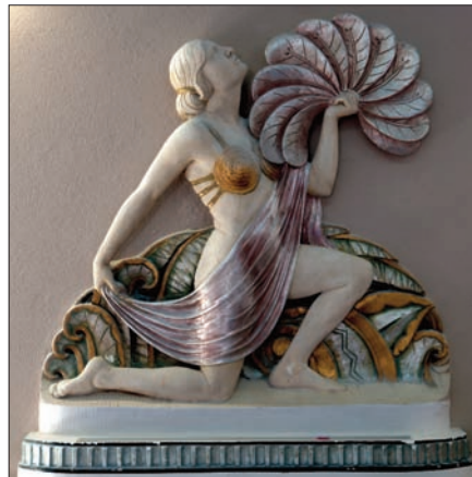
Détail au-dessus des portes du Snowdon (1937), chef-d'œuvre Art déco qui a malheureusement été scindé en deux.