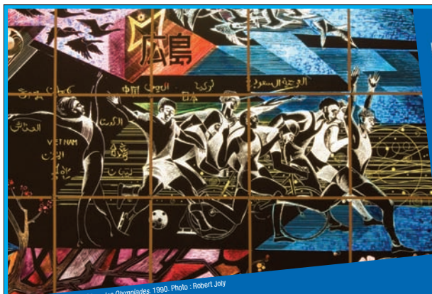
N. Sollogoub, Hiroshima, les Olympiades 1990.

Le forum Signé Sollogoub Le design dans sa diversité