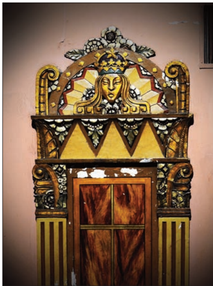
Au Château (1932), rue Saint-Denis, des personnages de plâtre fixent les spectateurs de leur regard vigilant.

■ Jérôme Labrecque est photographe, concepteur et communicateur.