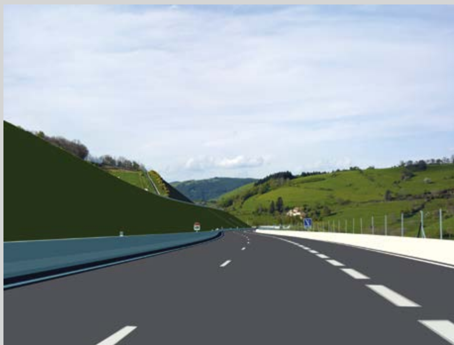
Alain Bublex, de la série L'optimisme au départ n'est plus de saison , 2014, permission de la galerie GP&N Vallois, Paris et Magnum Photos

En effet, dans les photographies de paysages, aux couleurs toujours très sombres, les arbres et les ciels torturés se chargent de menaces, de tensions sur le point d'exploser, dans un univers isolé et désolé qui semble avoir englouti les hommes mais non les spectres. Quant aux compositions en noir et blanc mettant en scène les relations humaines, elles apparaissent comme nourries du géométrisme inhérent à l'autoroute, tout en lignes, en trajectoires, en répétitions, comme si