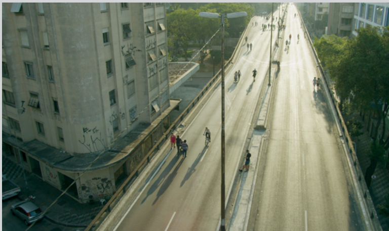
Above and Below the Minhocão , 2014

Michèle Cohen Hadria est née en 1950 à Tunis et vit à Paris. Diplômée des Beaux-arts (Rome, 1974) et d'une maîtrise en études cinématographiques (Sorbonne Nouvelle, Paris III, 1996), elle s'intéresse tant à l'art contemporain qu'au cinéma expérimental. Depuis 1998, elle a collaboré à des revues telles que art press , Jeune Cinéma (Paris), ETC , Ciel variable (Montréal), Third Text , n.paradoxa (Londres), Tema Celeste (Milan), Camera Austria (Graz, Autriche). Entre 1998 et 2014, elle s'est intéressée aux artistes du monde arabe et aux questions féministes et postcoloniales. En 2014, elle a publié, aux éditions féministes en ligne KT Press (Londres), trois entretiens d'artistes tunisiennes aux lendemains des soulèvements en Tunisie.