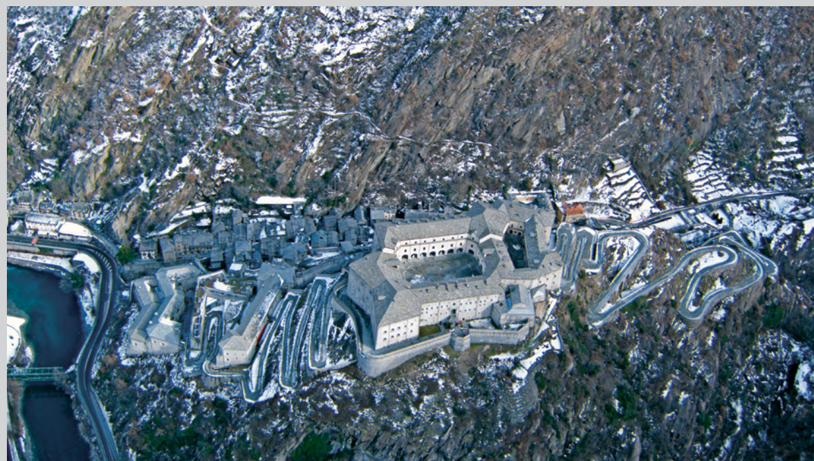
Fortel , 2010

elle publie également dans de nombreuses revues québécoises ( Spirale , esse , Ciel variable , Zone occupée ) et françaises ( Marges ). Elle a contribué à plusieurs ouvrages consacrés à la photographie ( Mois de la Photo à Montréal , Christian Marclay ) et a conçu le coffret photographique Loin des yeux . Les invisibles avec Le Cabinet (à paraître, 2015). Jeune commissaire, elle a obtenu la résidence du Conseil des arts et des lettres du Québec à l'International Studio & Curatorial Program (Brooklyn, 2013) et conçu plusieurs expositions, notamment celle de l'artiste Sayeh Sarfaraz au Québec et à New York.