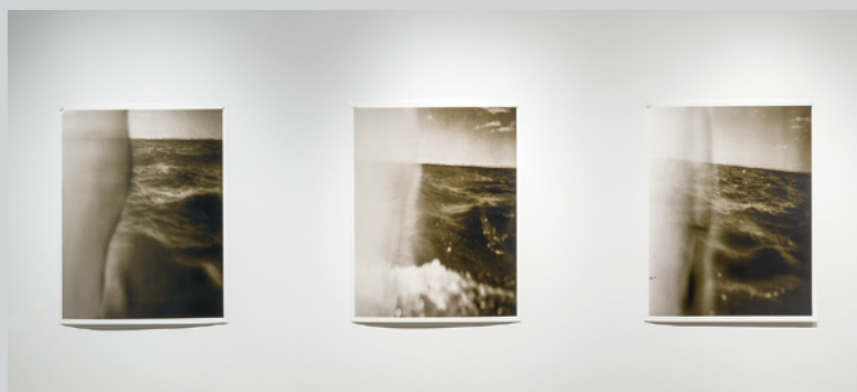
PEQUOD ('pi: 'kwad), 2015, exhibition view

These images of untamed water convey their ferocity with rare immediacy, and the vulnerability of the photographer equally well. That vulnerability is felt in confrontation with a natural force that is unrelenting, rife with numinosity – and inimical in its mien.