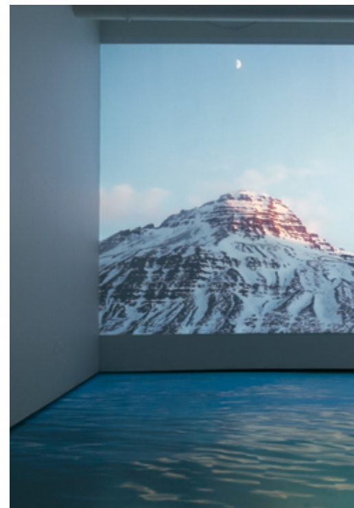
Where the Mountains Meet the Sun et/and Sunrise (January 20th) vue d'installation / installation view, 2015 vidéo HD / HD video vinyle adhésif / adhesive vinyl

Clearly, Auer shares with Danish-Icelandic artist Olafur Eliasson themes and concerns that stem from Maurice Merleau-Ponty's phenomenism. The viewer finds it impossible to remain passive or unmoved in the face of the Icelandic landscape and its radiant blue light in images such as Dusk (January 26th) and the remarkably compelling Fjord (January 27th) . Auer encourages us to consider luminosity, time, and place. As Sasha Engelmann has argued for Eliasson's work, In essence, the tenets of phenomenism provide the politicizing potential in Eliasson's installations, loosening the frames through which the audience is accustomed to viewing environments. The experience is humbling; viewers are introduced into