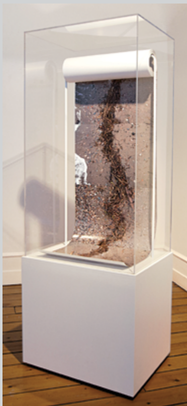
Anne-Renée Hotte, La laisse, 2016 , épreuve couleur, Plexiglas, métal et bois, 55 m

Bien que l'évènement se présente comme un ensemble d'expositions autour d'une thématique commune, modèle inventé en 1970 par les Rencontres d'Arles, il s'agit plutôt ici d'une vaste exposition collective dont les propositions individuelles sont disséminées entre le Centre d'art de Kamouraska et dix municipalités de la région. Au contraire