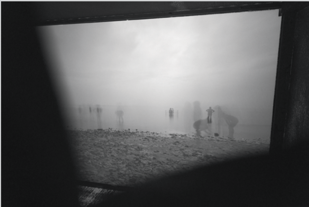
Steve Leroux, Projection 10, Fin de journée à la plage, Bonaventure, 2014 , projection, 81 × 122 cm