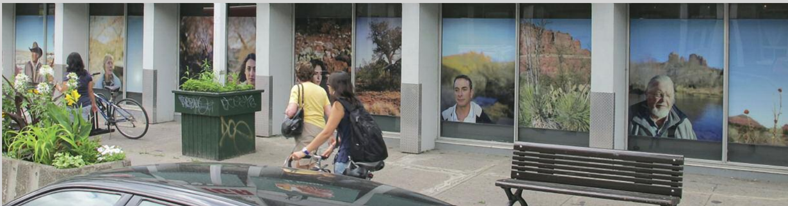
Andréanne Michon, Charm Strange , 2012, installation view, À louer / For Rent project, courtesy of UMA

Some of the highlights: Jessica Auer's three huge photographic images, installed on the walls of an empty storefront on Centre Street in Point St. Charles, take your breath away from the get-go. They are simply magnetic and pull viewers effortlessly into them: a spiral jetty; the archipelago-like outcropping of a glacier on which a lone figure stands; a mountain threshold teeming with tourists. And she holds us captivated. Her casual authority is such that we seem on the brink of an invisible