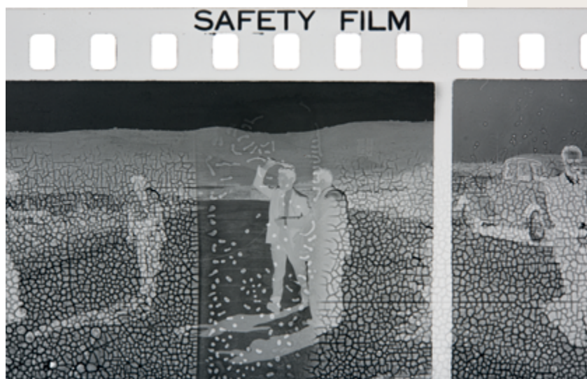
The Body of Film , 2017 onze impressions UV sur tissu avec rétroéclairage / eleven backlit UV prints on cloth vues d'exposition au MACBA / exhibition views at MACBA