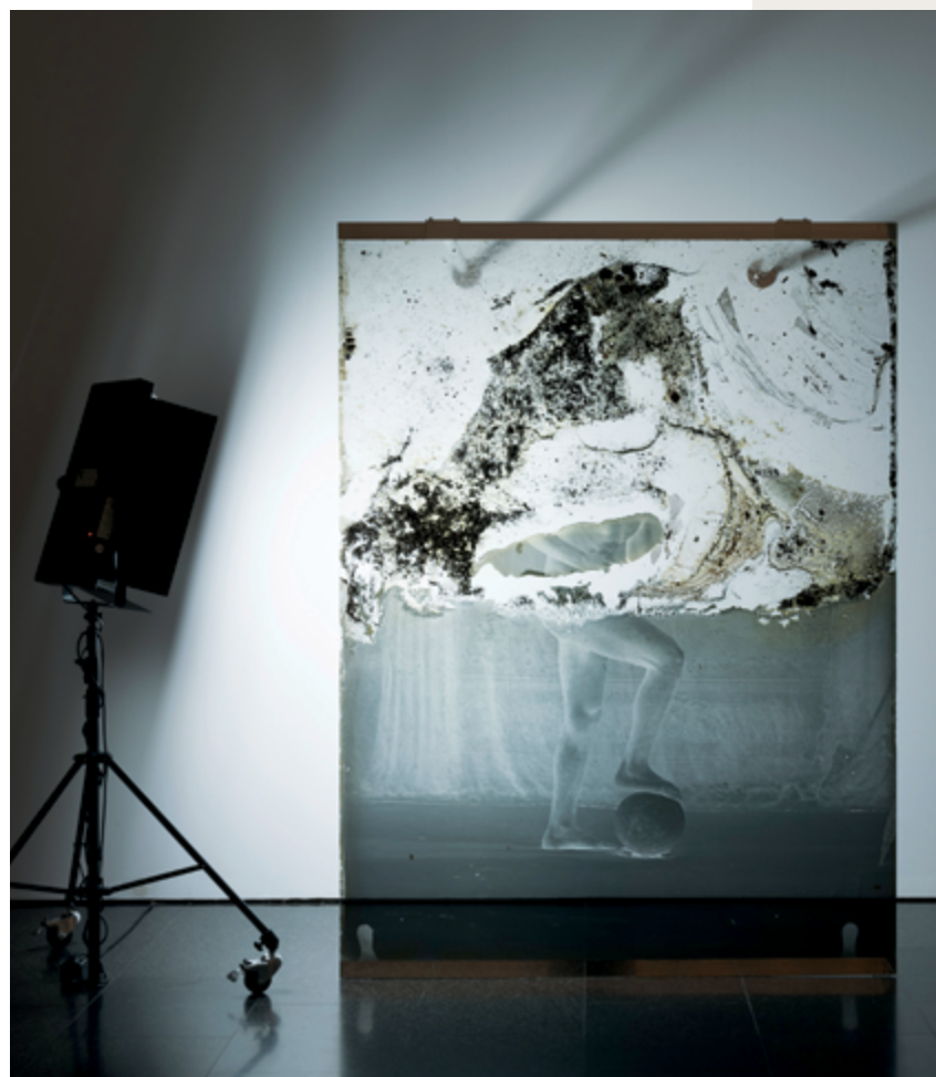
Archeology , 2017 impression jet d'encre pigmentaire / pigment inkjet print