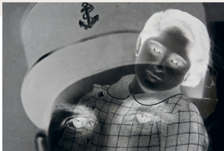
Faces to Faces, 2017 six impressions UV sur tissu avec rétroéclairage / six backlit UV prints on cloth vue d'exposition / exhibition view