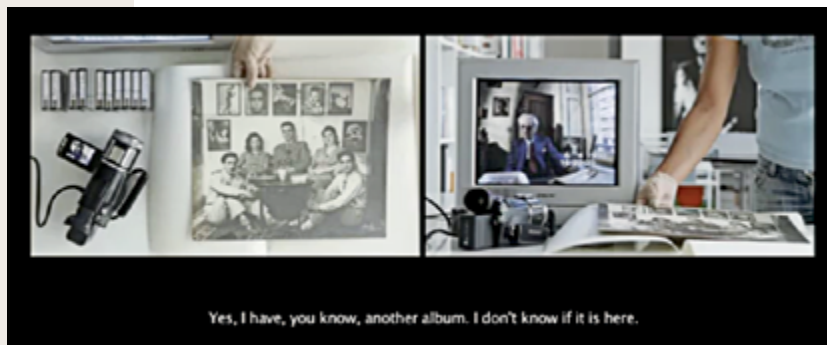
On Photography, People and Modern Times, 2010 extrait d'une vidéo deux canaux HD / excerpt from a two-channel HD video couleur, son / colour, sound, 38 min

en apparence banale, Zaatari insiste sur cette intrusion visuelle dans laquelle il voit un « agent de liaison » qui permet de rendre visible la relation entre l'image et son auteur.