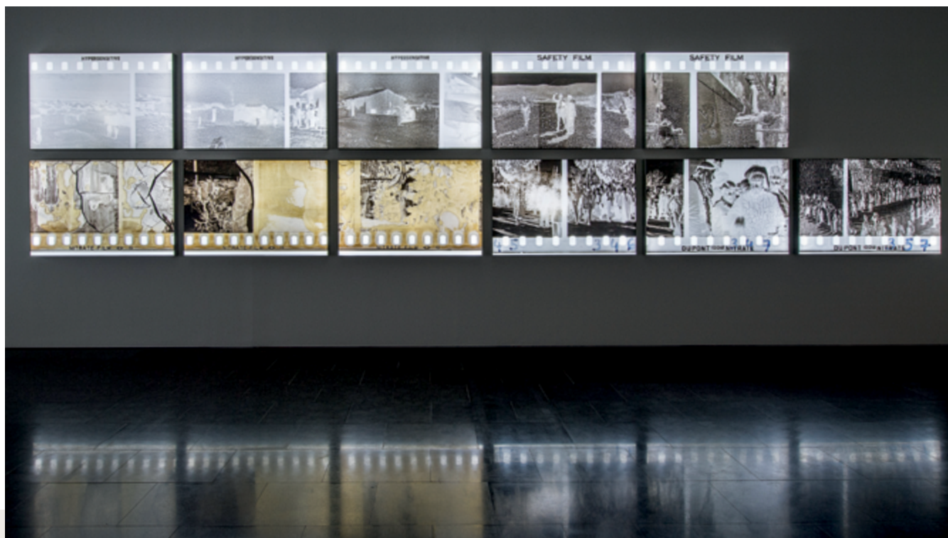
The Body of Film , 2017 onze impressions UV sur tissu avec rétroéclairage / eleven backlit UV prints on cloth vue d'exposition au MACBA / exhibition view at MACBA

In the last part of the exhibition is another of the major themes addressed by Zaatari; his emphasis on the "corporality" of the image is a way of dealing with the question of the photographic matter and the processes of erosion, in which "accidents" that may occur to the film due to poor conservation become the metaphor for "accidents" of history that appear implicitly. The conception of the