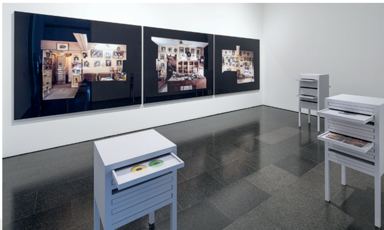
Objects of Study / Studio Scheherazade - Reception Space, 2006 vue d'exposition au MACBA / exhibition view at MACBA, trois épreuves couleur images composites / three colour prints made from composite images

A similar concern with exhibition of the body – this time, young Lebanese men who want to display their masculinity – is also found in the pictures by Madani. Zaatari devoted his video Twenty-Eight Nights and a Poem (2015, 100 min.), commissioned by the Musée Nicéphore Niépce, to Madani's practice. It is a moving tribute to the photographer, whose work was also the subject of two shows at the AIF: Haschem el Madani: Studio Practices (2004) and Haschem el Madani: Promenades (2006). The video camera lingers on Madani's pictures taken in the city, near stores, in souks, and on the beach. His lens always offered a powerful opportunity for exhibition – sometimes in posed positions, others candid. In fact, it is in relation to the photographs taken by Madani on the beach that one of the most poetic sequences in the film is built. From negatives of the time examined under a magnifying glass by Madani, there is a