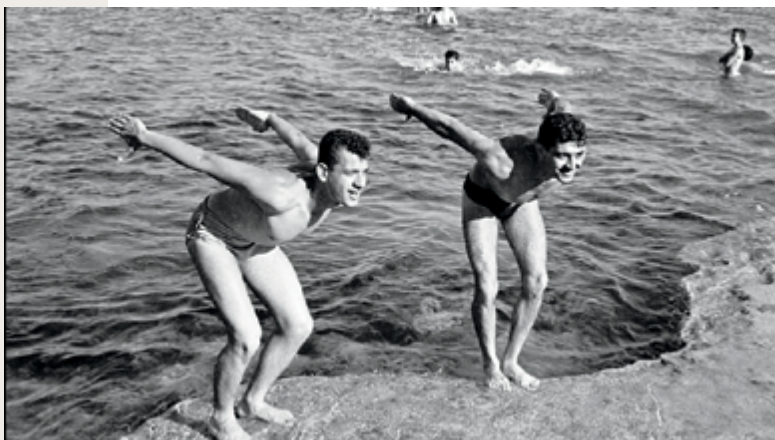
Twenty-Eight Nights and a Poem , 2010 deux extraits d'une vidéo faisant partie d'une installation multi-médias / two excerpts from a video that is part of a mixed-media installation