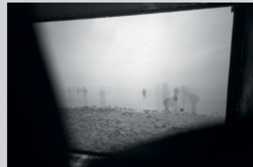
Fin de journée à la plage, Bonaventure, 2014, de la série Projections 2014-2019, impression jet d'encre