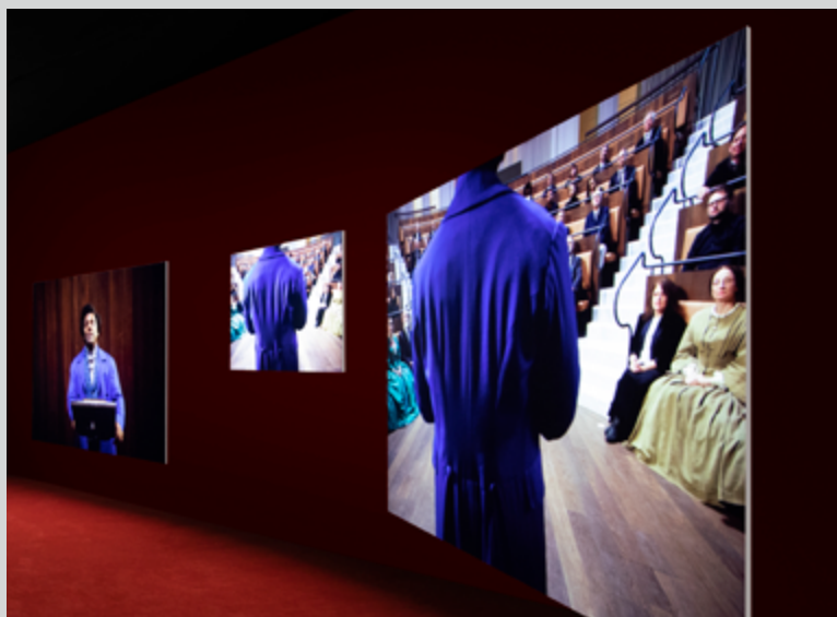
Vues de l'installation Frederick Douglass: Lessons of the Hour , SCAD Museum of Art, 2019

Dans le tableau suivant, la première femme de Douglass, Anna Murray Douglass, interprétée par Sharlene Whyte, est filmée en train de coudre un très chic veston. Les bruits de sa machine à coudre s'entremêlent à ceux