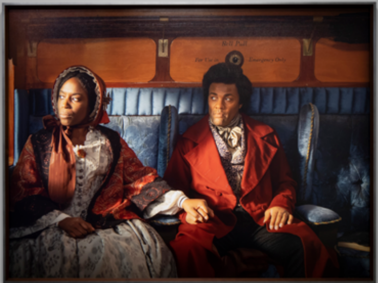
North Star, de la série Lessons of the Hour, 2019