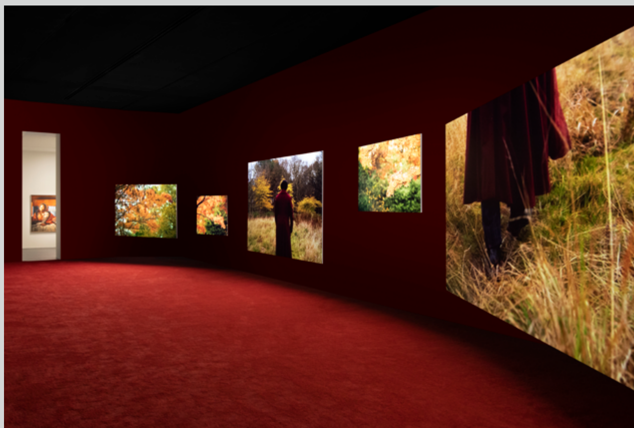
Vue de l'installation Frederick Douglass: Lessons of the Hour , SCAD Museum of Art, 2019