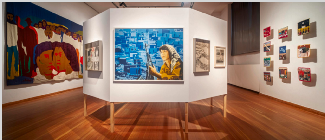
Vue de l'installation Museo de la Solidaridad Salvador Allende, Berlin Biennale, 2020