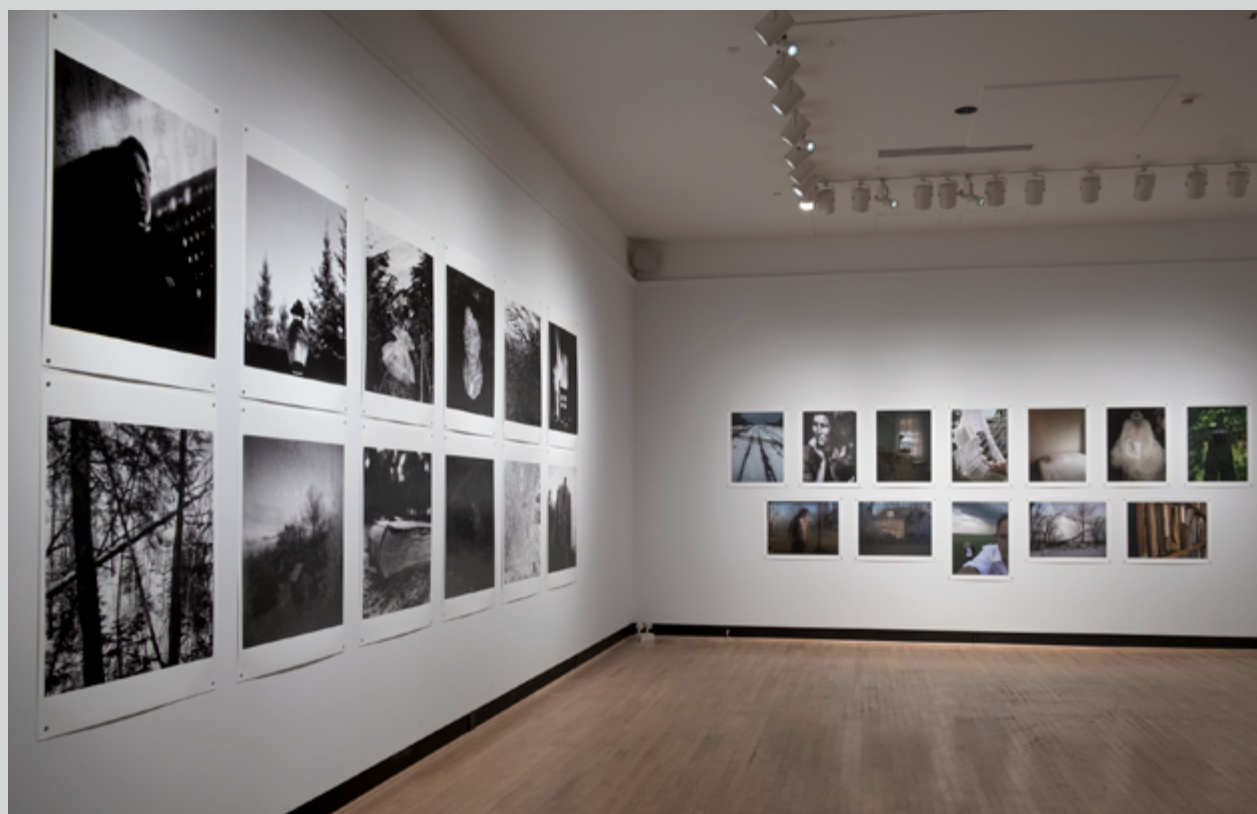
Vue de l'exposition, Galerie d'art Antoine-Sirois de l'Université de Sherbrooke, 2020, photo : François Lafrance

En plus, il fallait veiller à un certain équilibre et, ici, le nombre d'images retenues est suffisant pour donner une idée de la trame complète. Aucun des blocs ne vient voler la vedette, même si la taille des impressions de Miroirs acoustiques retient l'attention. Devant cette série, on s'interroge sur les masses montrées, dont les tons de gris se perdent dans les alentours et les végétaux. Ce sont des constructions paraboliques qui faisaient office de radars sur les côtes britanniques lors des deux guerres mondiales. On plaçait des microphones au point le plus cavé de leur concavité et on pouvait détecter les avions approchant. Certains se trouvent à Dungeness, en face de Dieppe, qui a aussi été un lieu