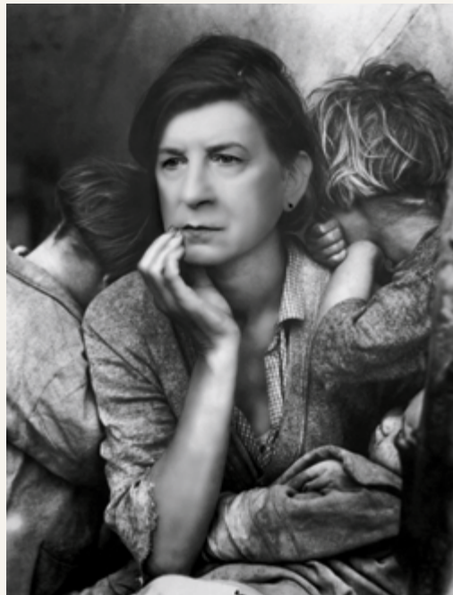
After Grove from the series / de la série After, 2020

cs: No! You need to pay attention – I already said that the publication came first. Initially I was offered a retrospective at Expression, but instead I proposed a large exhibition based on the concept of the book. Both Expression and Plein sud were interested in having the show occupy both venues and they expressed an interest in co-editing the publication along with Kerber Verlag in Germany. The book will