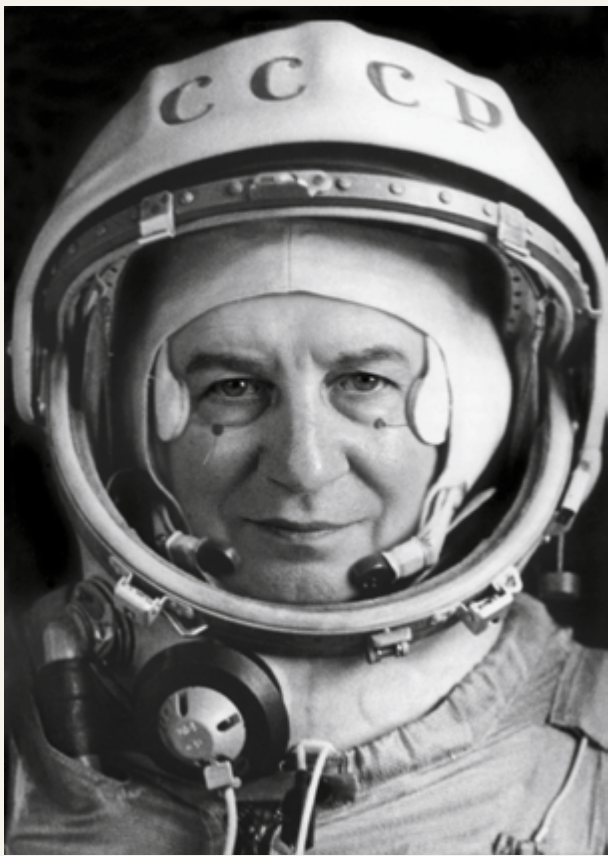
After Fontcuberta, from the series / de la série After, 2020

de leur contexte peuvent être manipulées. Le projet s'intitule On Photography , d'après le recueil d'essais de Sontag de 1977 qui fait référence.