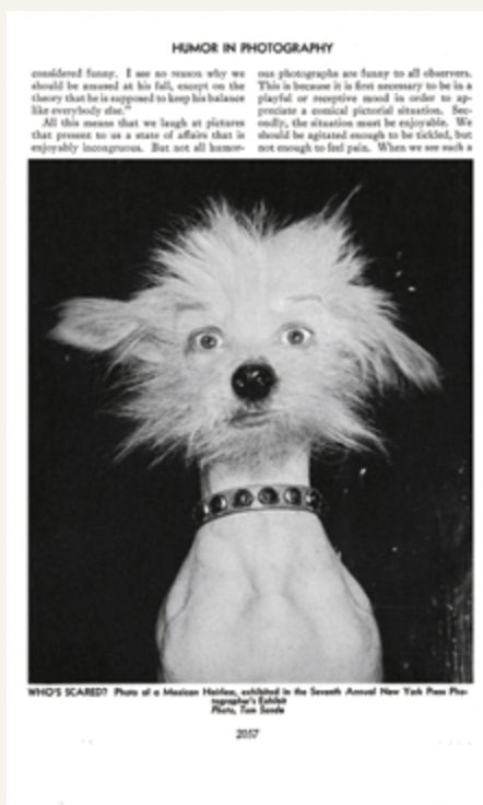
Humor in Photography , p.2057, from the series / de la série The Complete Photographer , 2020

cs : Outre ces nouvelles œuvres, j'ai entendu dire que vous préparez la sortie d'une publication et que vous