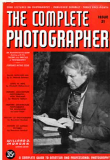
Cover, Issue 31, from the series / de la série The Complete Photographer, 2020

Muniz et Jeff Wall, mais j'ai été contrarié par des soucis logistiques et financiers. Si j'avais disposé de plus de temps et d'argent, je me serais attaqué à plus de sujets couverts par The Complete Photographer , comme la photographie sur les thèmes des clowns et des cirques, de la criminologie, des expéditions, des fermes, de la mode, de la médecine, des actualités et de la publicité.