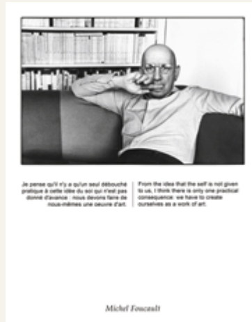
After Franck/Foucault, from the series / de la série On Photography, 2020

cs : En un mot, oui. En fait, j'irais même jusqu'à dire que, dans l'ensemble, je suis extrêmement satisfait de la façon dont les choses se sont déroulées. Bien sûr, il y a quelques légers regrets. Par exemple, dans On Photography , j'aurais adoré « devenir » les images d'autres critiques que j'admirais et qui ont aussi pu influencer ma pensée et ma pratique. Malheureusement, je n'ai pas réussi à mettre la main sur les bonnes citations et/ou des portraits publiés exploitables d'Okwui Enwezor, Rosalind Krauss, Laura Mulvey et Abigail Solomon-Godeau. Avec After , j'aurais aimé reprendre des œuvres d'appropriation de Barbara Kruger, Vik