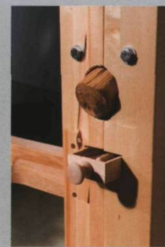
Guy Ben-Ner Treehouse Kit , 2005 Installation vidéo IMAGE DE GAUCHE et détails d'installation AUTRES IMAGES Sculpture en bois, tapis et projection vidéo Dimensions variables Avec l'aimable permission de Postmasters Gallery, New York Photo: Richard-Max Tremblay