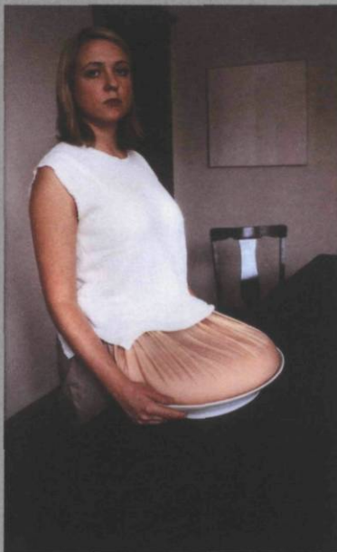
Jeanne Dunning On a plater , 1999. Ilfochrome monté sur plexiglass. 132 x 85 cm

Il n'est pas sans pertinence d'évoquer ici la réflexion de Catherine Grenier qui, dans son livre Dépression et subversion , fait abondamment état des stratégies employées