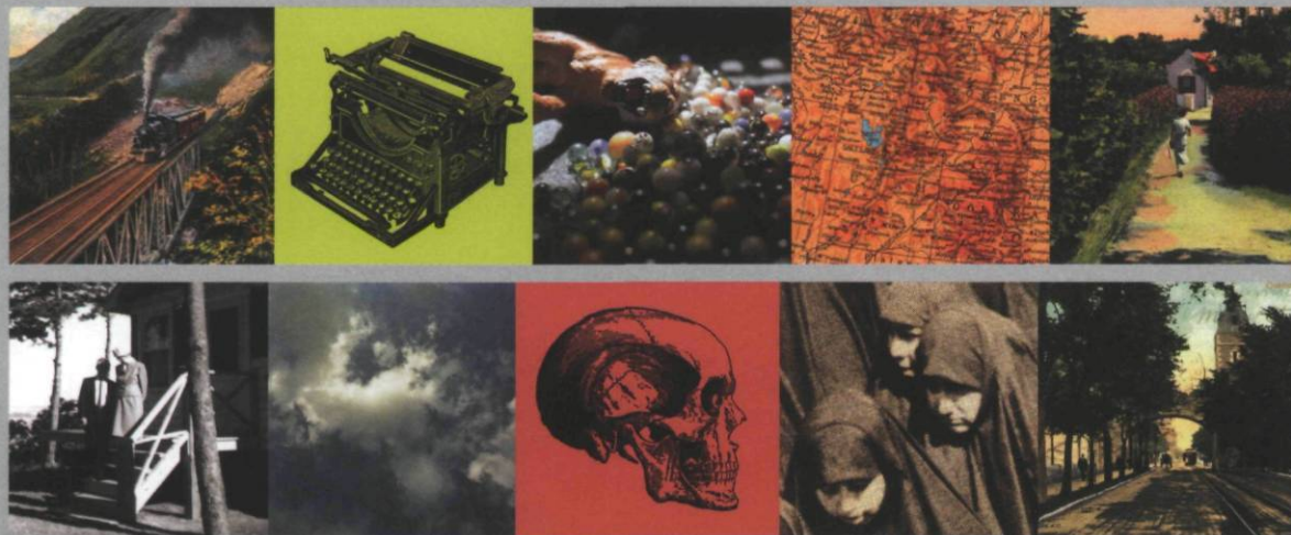
Marques de l'exsangue, polyptyque 1, 2006-2007 Photographie argentique et numérique, impression au jet d'encre, 91,5 cm X 457,5 cm