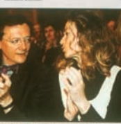
ENFANGEN SCHÜSSEL: „Aber, wenn er sich mit Haider einigt“

Bei der gemeinsamen Pressekonferenz von Schüssel und Haider am Dienstag vergangenen Woche gab der Kanzler seinem neuen Kampagnenleiter in aller Öffentlichkeit nischelnde Anweisungen.