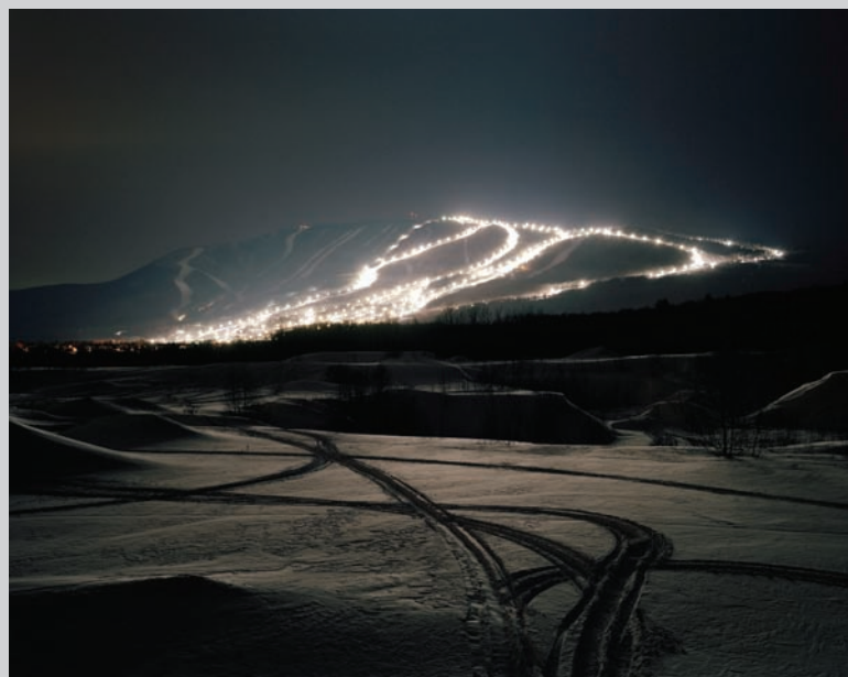
Thomas Kneubühler, electric #9 , 2009, épreuve chromogénique, dimensions variables.

Il s'agit bien donc d'une insistance et d'une propension vers la rigueur. Le sujet est répété pour que l'on voie bien qu'il s'agit d'une récurrence, donc significative. Constante prouvée par cette répétition et cette insistance sans fard ni théâtralisation. Nous avons bien là un « cas », un invariant qui mérite examen. Puis viennent les images devant faire le tour du sujet. Pour ne pas nuire à l'observation rigoureuse, il est décidé de les présenter sobre-