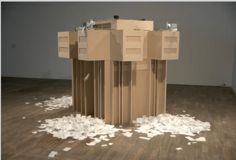
José Carlos Martinat, Stereo Reality Environment 3: Brutalismo , 2007, installation interactive, coll. du Tate Modern

politique au Pérou dans les années 1980] entre des écrans (allumés puis soudainement éteints par des explosions [terroristes causées par le Sentier lumineux]) qui montraient des jeux vidéo et des dessins animés, en alternance avec des bulletins d'information annonçant l'hyperinflation, des épidémies, des génocides et la destruction » 1 .