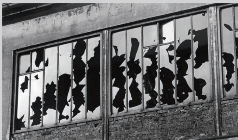
Brassaï, Sans titre , vitres cassées d'un atelier de photographe, c. 1934, épreuve argentique, 17,3 x 29,8 cm, Musée Folkwang, Essen

Quelque vingt-cinq ans après Explosante fixe . Photographie et surréalisme , exposition conçue en 1985 par Rosalind Krauss et Jane Livingston, le Fotomuseum Winterthur présente une exposition 1 d'envergure qui entend recenser et analyser les diverses fonctions assignées par les surréalistes aux images indicielles. À l'aide de plus de 400 œuvres plastiques, une dizaine de films et une centaine de documents, distribués suivant neuf sections thématiques, l'exposition rassemble les travaux de ces figures de proue du mouvement que sont Man Ray, Kertesz et compagnie, mais présente aussi des œuvres moins connues – envoûtantes mises en scène photographiques d'Artaud, par