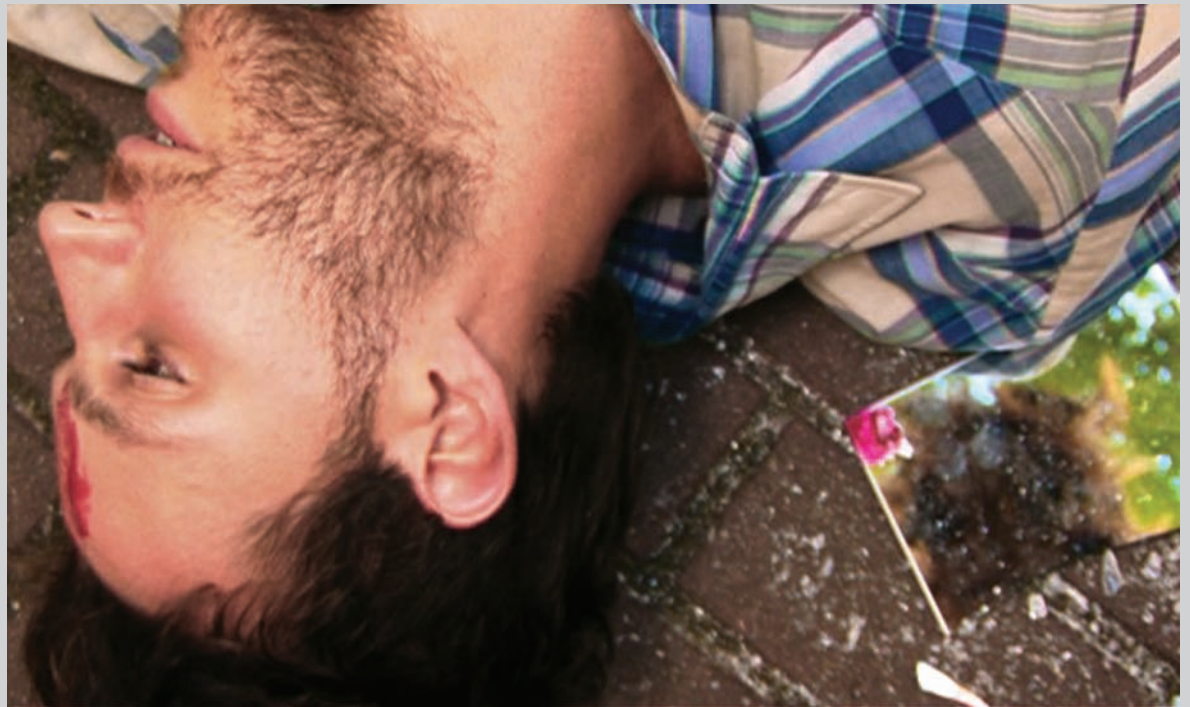
Keren Cytter, Cross , 2009, image tirée du triptyque vidéo Untitled (Cross, Flowers, Rolex) , 15 min

Alors que le cinéma de divertissement nous prépare à des récits cohérents, où l'illusion de réalité amène le spectateur