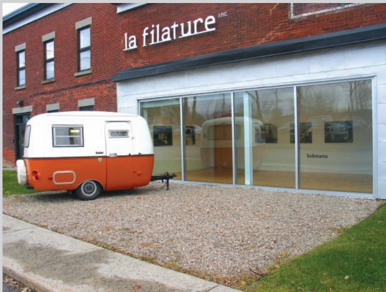
Lise Beaudry, Bolerama , vue d'exposition, 2010, Axénéo7, Gatineau

the little fold-out table in Beaudry's Boler outside the gallery, visitors can hear stories by and interviews with participants, as well as ambient campground sounds, coming from a system of small, rounded speakers that are similar to the aesthetic of the Boler.