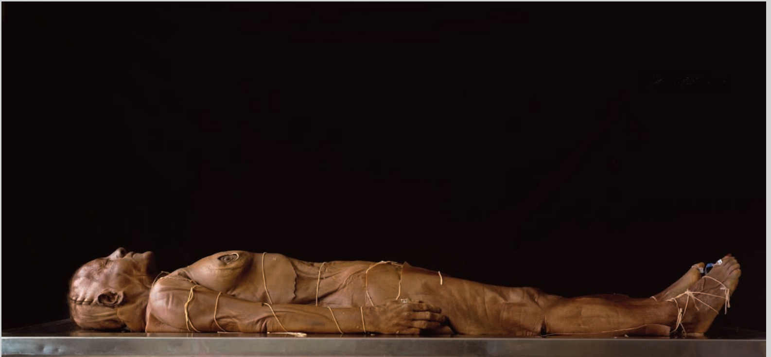
Jack Burman, Untitled #13 , 1999, de la série / from the series The Dead , épreuve chromogénique / c-print, 95 cm x 168 cm, permission de / courtesy of Clint Roenisch Gallery, Toronto