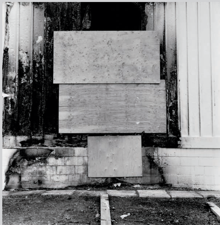
From the series Auto Mnemonic Six Nations , 2007, toned silver print, 76 x 76 cm

Les personnages représentés sont sa belle-mère, un ami, son fils. Ils fixent l'objectif, le regard dur et l'air distant. Plus qu'en peinture, il semble que le regard direct dans l'objectif soit très perturbant, probablement parce que plus vivant. Il y a également des personnages qui nous semblent moins statiques, qui bougent, comme cette femme qui se prépare pour