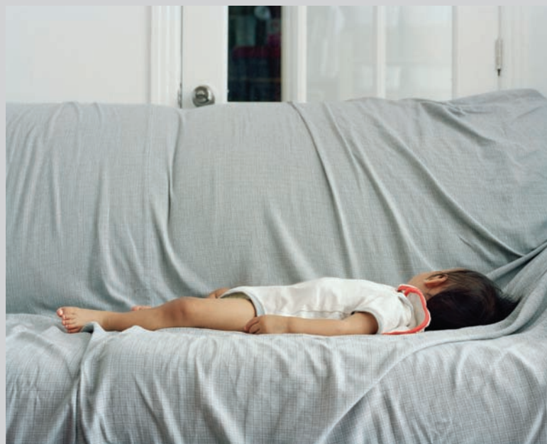
Shaore Lies on Futon , 2011, inkjet print, 101,6 x 127 cm

— James D. Campbell is a writer on art and independent curator based in Montreal. The author of over 100 books and catalogues on contemporary art and artists, he contributes frequently to visual arts publications across Canada and abroad. —