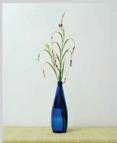
Blue Bottle , 2011, inkjet print, 101,6 x 81,3 cm