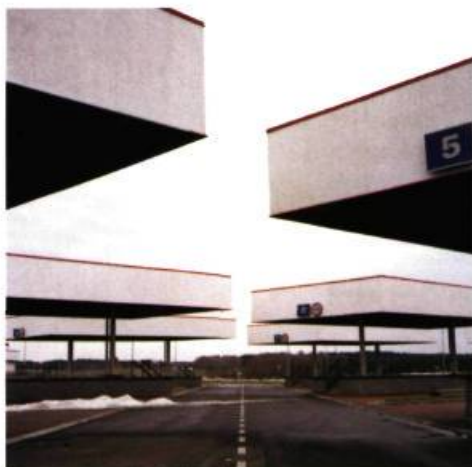
N 49°57'22.5" – EO 23°06'40.4"