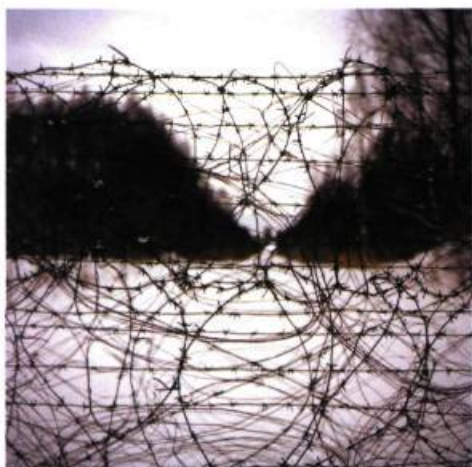
N 57°49'24.4" – EO 27°32'44.9"