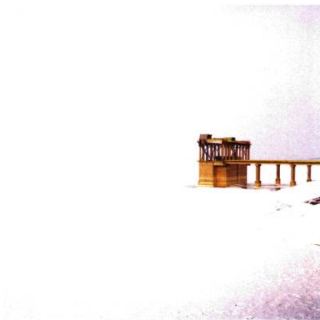
N 47°50'14" – EO 27°13'19.3"