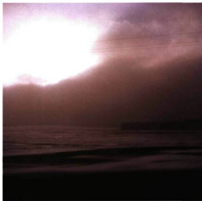
N 55°03'34.8" – EO 22°35'33.3"