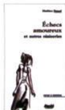
ÉCHECS AMOUREUX ET AUTRES NIAISERIES Stanké, 2004