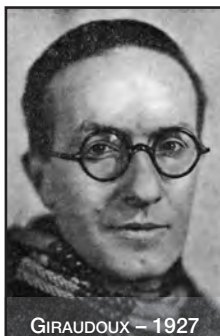
GIRAUDOUX – 1927

Régulièrement rejouée dans de nombreux pays, la pièce a été adaptée en comédie musicale en 1969, au cinéma en 1970 avec Katharine Hepburn dans le rôle titre ( The Madwoman of Chaillot ) et en ballet en 1992. Le texte de la pièce est publié chez Grasset.