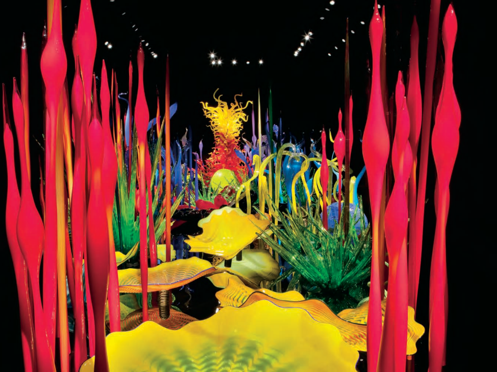
Dale CHIHULY, Mille Fiori , 2008. 2,9 x 17,1 x 3,7 m. Photo: David EMERY. Avec l'aimable autorisation / Courtesy Musée des beaux-arts de Montréal.

Toutes ces accusations qui reconduisent le mythe romantique de l'artiste authentique sensé s'épanouir dans la misère sont en somme assez inconséquentes par comparaison au regard sévère porté sur ses œuvres. Par exemple, en 2011, le lauréat du prestigieux Pulitzer Price pour la critique en histoire de l'art aux États-Unis, Sebastien Smee 7 , au demeurant peu intéressé à la réputation sulfureuse de Chihuly, emploie des termes très durs à l'égard de son travail : « absence de concept », « manque de profondeur et de retenue » et, pis encore, « de mauvais goût ». Aussi bien en rajouter : kitch, tape-à-l'œil et bling-bling. C'est dire que la surabondance de formes et de couleurs peut heurter plus que séduire. Or, Smee le reconnaît, le « goût » est une affaire de codes de réception variables, fondés sur des a priori de divers ordres. À défaut de pouvoir ici creuser la question des changements d'attitude à travers les temps, il suffit de souligner qu'après des décennies d'éloge, le « spectaculaire » a peut-être atteint son point de saturation 8 .