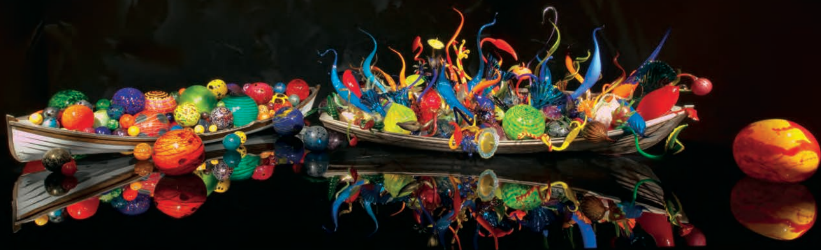
Dale CHIHULY, Mille Fiori , 2008. 2,9 x 17,1 x 3,7 m.

entre autres Venise et Jérusalem, ainsi réaménagés en carrefours trans-temporels et transculturels où, pour le temps de leur exposition, les lustres chatoyants et voluptueux ravivent plus qu'ils ne contredisent l'architecture marquée par l'usure.