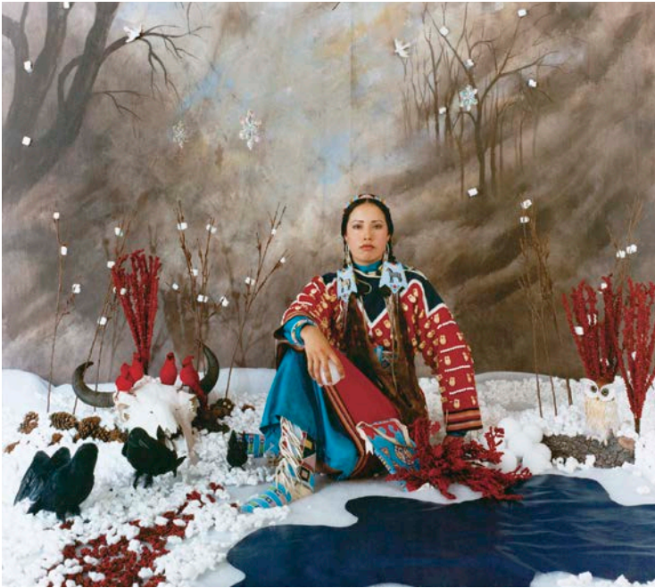
Wendy Red Star, Winter (from the series Four Seasons ), 2006. Photograph, 76 x 101 cm.