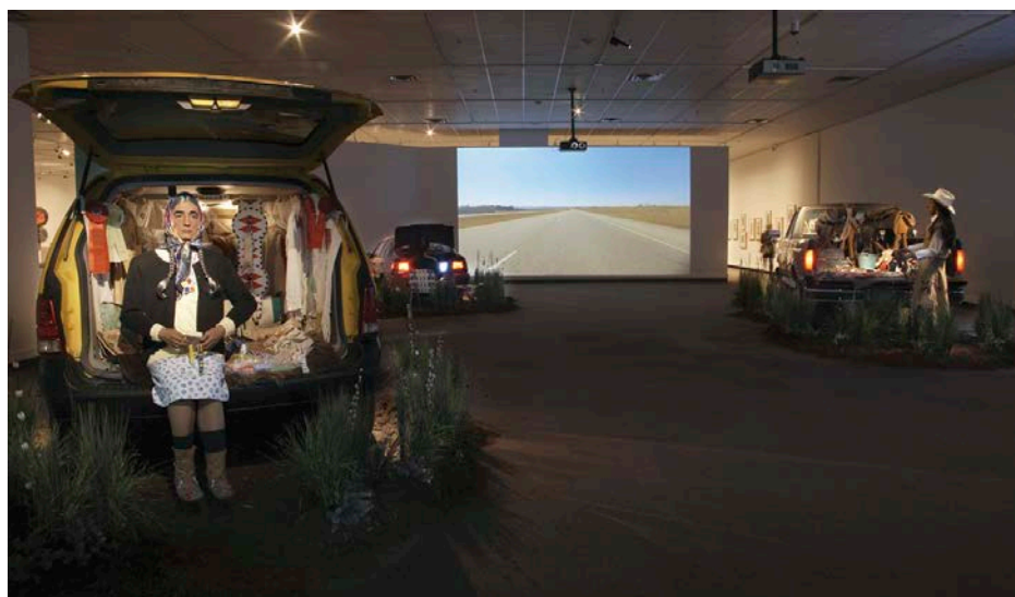
Kent Monkman, The Big Four , 2013. Installation multimedia/Multimedia installation, dimensions variables/variable dimensions.

parisien occupé par Miss Chief Eagle Testikle, l'alter ego de l'artiste, et différents animaux naturalisés (un castor, un coyote, un corbeau); Lot's Wife , en 2012, se présentait comme un dialogue entre sculpture et vidéo en forme d'hommage à la grand-mère crie de l'artiste et, en 2013, The Big Four , une installation produite à l'occasion du centième anniversaire du Stampede de Calgary faisait également une large place à la vidéo. La dernière installation en date, Bête Noire , était présentée au printemps 2014, à galerie Sargent's Daughters à New York, et ensuite à la nouvelle biennale de Santa Fe SITelines: New Perspectives on Art of the Americas jusqu'au début de l'année 2015, est la plus intéressante pour notre propos, car c'est des quatre installations celle qui reproduit le plus fidèlement le dispositif original du diorama. Une des singularités de Bête Noire est qu'elle ne vise pas l'esthétique du diorama en général, mais qu'elle cite un diorama bien précis : celui qui accueille les visiteurs