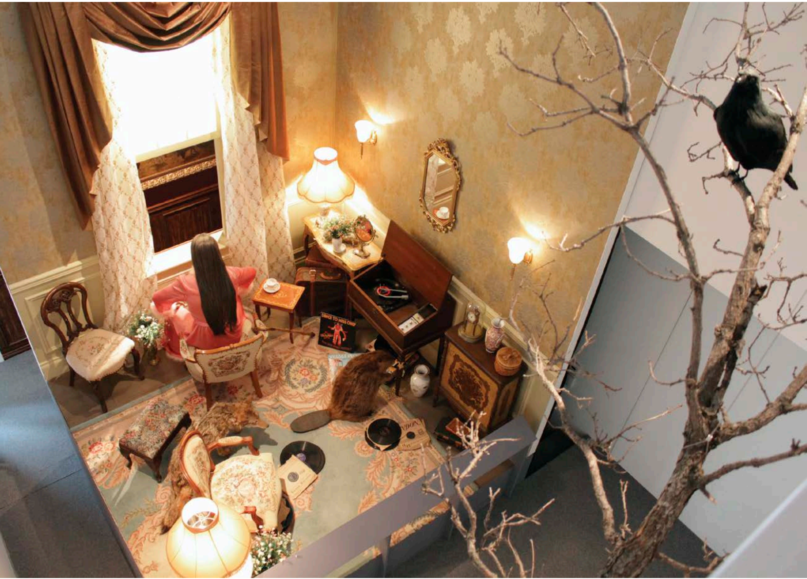
Kent Monkman , The Collapsing of Time and Space in an Ever Expanding Universe , 2011. Installation multimédia/ Multimedia installation, 6,4 X 4,2 X 4,9 cm. Photo : avec l'aimable autorisation de/ Courtesy of Plug In ICA, Collection of La Maison Rouge.