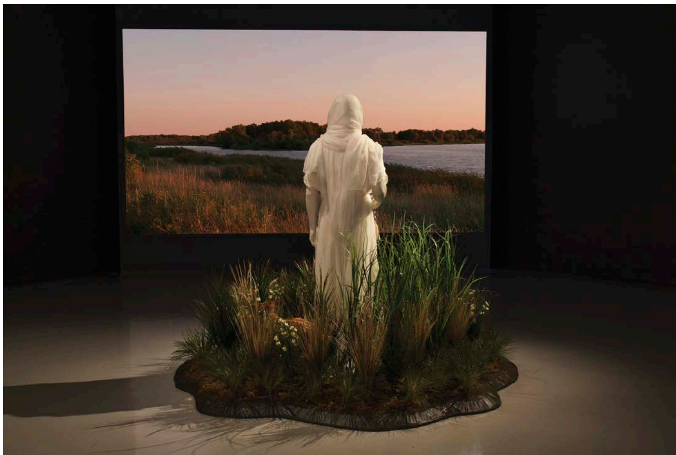
Kent Monkman , Lot's Wife , 2012. Installation multimedia/Multimedia installation, dimensions variables/ variable dimensions. Photo : Elaine Stocki for the Winnipeg Art Gallery Collection of Vickie and Kent Logan/ The Denver Art Museum.

écho à un tableau au format panoramique (180 x 301 cm), The Last of the Buffalo (1888), du peintre paysagiste Albert Bierstadt, un des artistes du XIX e siècle le plus souvent « revisité » par Monkman pour ses oublis et ses erreurs historiques concernant les Premières Nations. C'est encore le cas dans cette toile dont le titre et certains éléments iconographiques (comme l'amoncellement de carcasses) laissent entendre que les chasseurs des Premières Nations, armés de leur seule lance, seraient responsables de la quasi-extinction des bisons au XIX e siècle, alors que ce sont évidemment les chasseurs d'origine européenne, dont le plus connu, Buffalo Bill, qui se livrait au très lucratif commerce de la fourrure. Ajoutons que Monkman est, bien entendu, au fait que le mythe du Vanishing Indian a souvent associé le destin des Premières Nations et celui des bisons, les uns et les autres étant passés de plusieurs dizaines de millions d'individus avant l'arrivée des Européens à quelques centaines de milliers au milieu du XIX e siècle. Le peintre et voyageur américain George Catlin, une des autres cibles favorites de Monkman, a par exemple couché sur papier ses « réflexions sur la probable disparition totale des bisons et des Indiens s » lors de son voyage dans les plaines en 1832-1839.