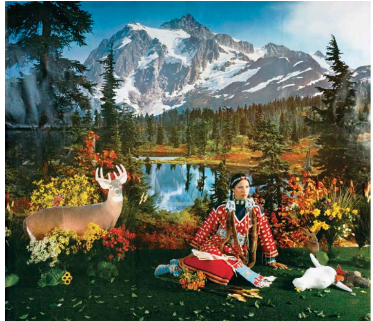
Wendy Red Star, Indian Summer (from the series Four Seasons ), 2006. Photograph, 76 x 101 cm.