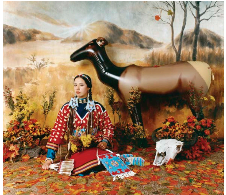
Wendy Red Star, Fall (from the series Four Seasons ), 2006. Photograph, 76 x 101 cm.