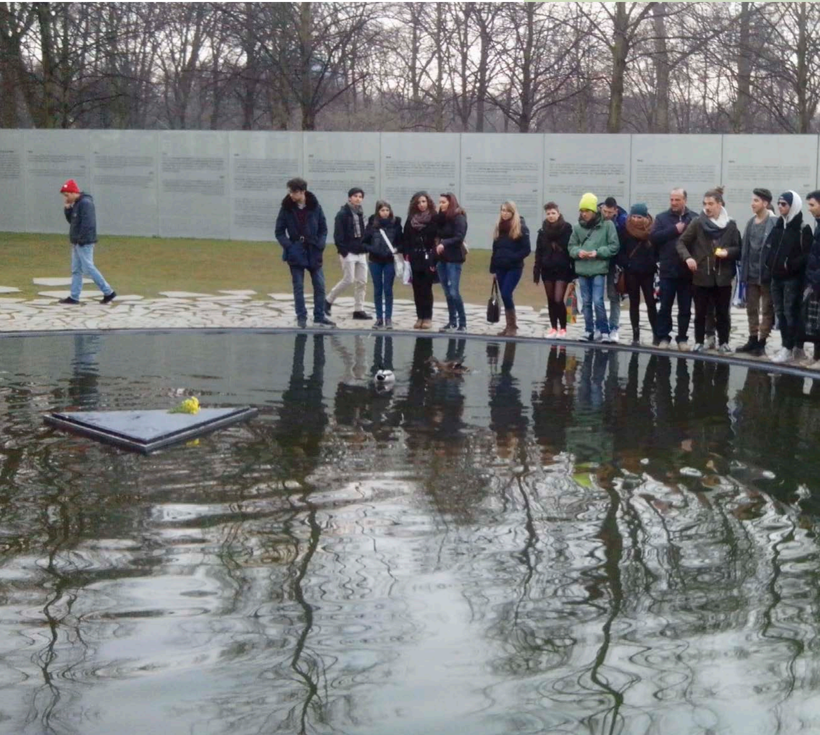
A group of students visits the Roma Holocaust Memorial, March 2014. In the background, the panels displaying the chronology of Nazi persecution, 1933-1945/ Un groupe d'étudiants visite le Mémorial aux Roms victimes du nazisme, Mars 2014. À l'arrière-plan les panneaux affichant la chronologie de la persécution nazie, de 1933 à 1945.