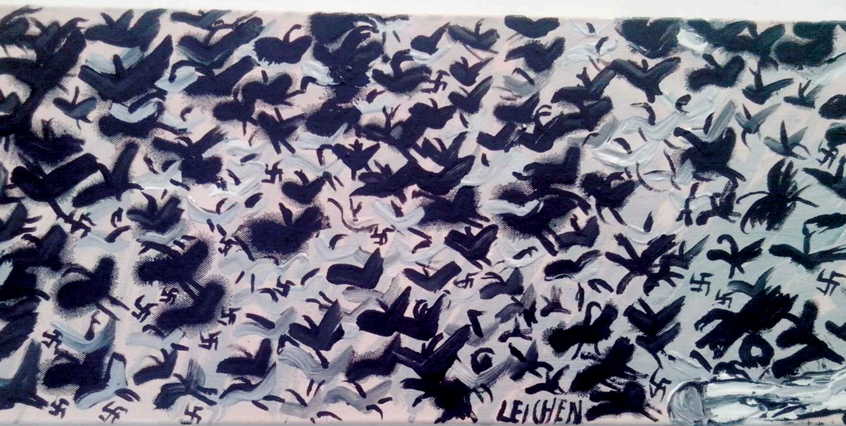
Ceija Stojka, Leichen , 2007. In the retrospective/ lors de la rétrospective Die Hellen Bilder , 2014, Galerie Kai Dikhas.