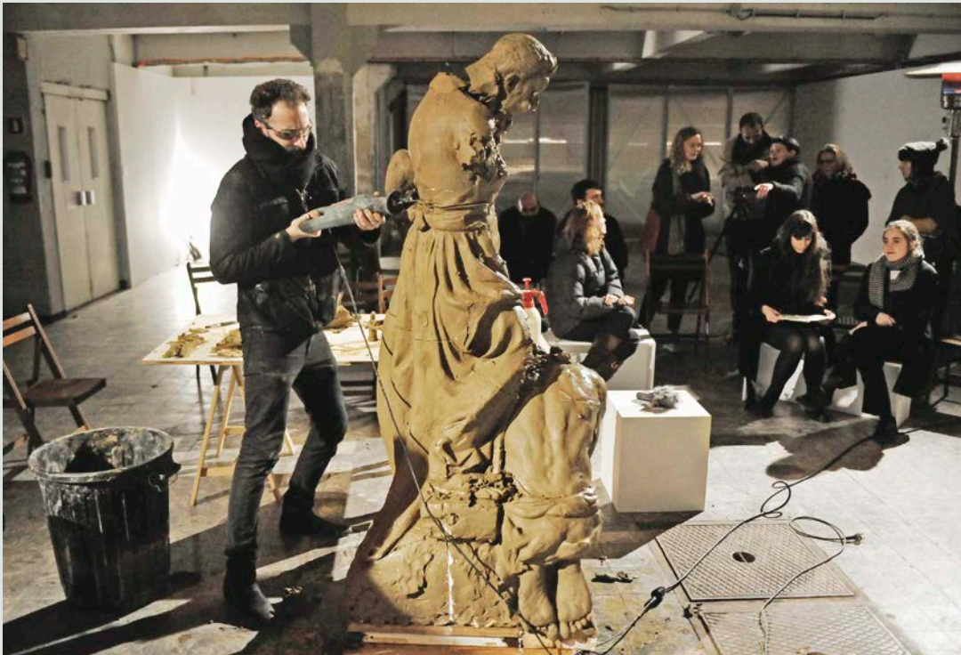
Ibrahim Mahama, Silent Recreations , 2018. Action performative et participative dans le cadre de son exposition On Monumental Silences à la Kunsthall Extra City, Anvers.

Entre détruire les monuments ou les préserver en tant que documents historiques, comme l'indique Michel Melot, « on a le choix entre le sacrilège et l'injure. 14 » Les enjeux sont multiples, car ils dépassent le champ de la préservation patrimoniale, de l'histoire de l'art et de l'aménagement urbain pour s'étendre aux questions de droit à la ville et de justice sociale. Au Canada, un consensus semble cependant émerger depuis les déboulements des monuments états-unis et canadiens en 2017 et 2018 : il est temps d'abandonner la posture antiquaire qui voudrait tout préserver à tout prix pour faire le ménage dans le bric-à-brac des choses et des idéaux désuets et malsains, dans une perspective de réconciliation. Pragmatiquement, il faut admettre que les villes et les monuments qui les habitent n'ont jamais été permanents, tout comme Henri Lefebvre le disait, il y a