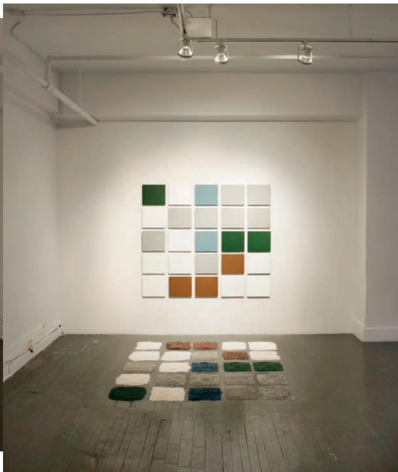
Simon GRENIER-POIRIER, Le temps d'eaage est une peinture , 2012. Installation. 160 x 355,6 cm.