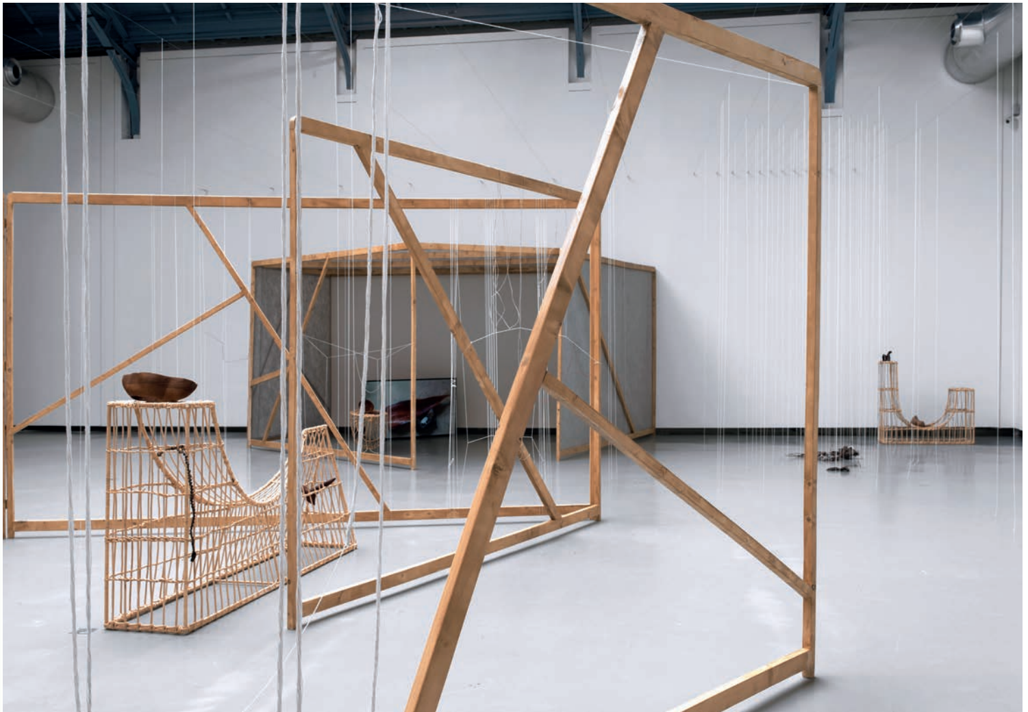
Mimia Biabiany, Musa nuit , 2020. Vue partielle de l'exposition.

les formes délicates de ces parties du corps suggérées par les pleins et les vides convoquent à une (ré)articulation des objets entre eux, mais plus encore à un repositionnement de la femme au sein de la société matrifocale guadeloupéenne. Initialement conçues pour être manipulées par le visiteur, avant les restrictions induites par le virus, les surfaces lisses des sculptures, toutes en sensualité et en préciosité, abrogent la distance que pourrait induire leur apparence sexuelle et leur nature d'œuvre d'art. Le visiteur n'est pas seulement convié à observer, mais il est invité à se positionner et à devenir l'acteur d'une nouvelle relation avec ces formes et les marques de leur histoire. Ce mouvement de conscientisation redonne place aux organes et à la féminité traités non pas comme des objets de désir, mais comme les clefs de voûte d'un lieu que l'on occupe. Biabiany articule le corps qu'elle honore et le dispositif architectural comme des structures similaires au sein desquelles peut prendre place la définition d'une identité féministe, écologique et décoloniale.