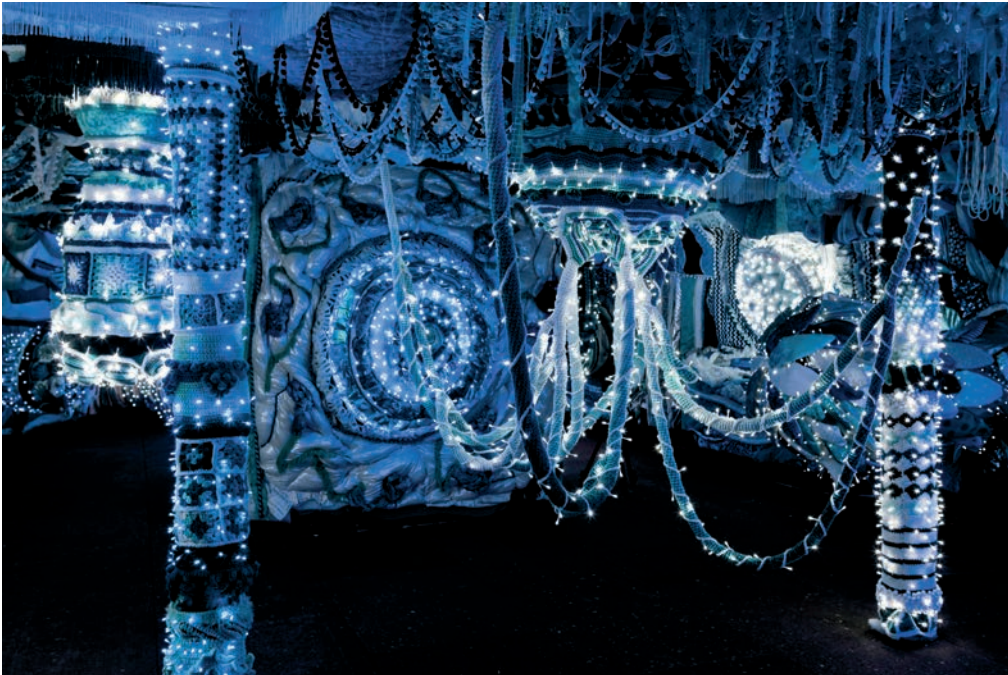
JOANA VASCONCELOS, TRAFARIA PRAIA , 2013. DETAIL OF THE INSTALLATION I - VALKYRIE AZULEJO - PHOTO : LUIS VASCONCELOS, © UNIDADE INFINITA PROJECTOS

In counterpart to this work is the refitting of the boat's interior with a decor that is also artisanal and dominated by the colour blue, but which reveals a more feminine universe than the exterior. As in the belly of a whale, passing through opaque curtains, one enters into this dark and mysterious place, lit here and there with small LEDs and populated with peculiar crocheted shapes. This technique, which Vasconcelos uses throughout her work, whether to cover ceramic objects or to produce soft