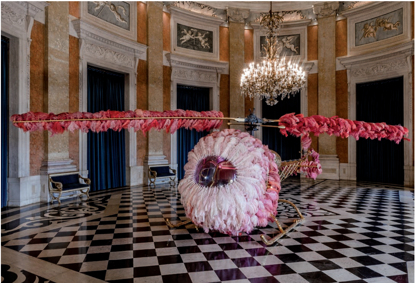
JOANA VASCONCELOS, LILICOPTERE , GALERIE DES GLACES, CHATEAU DE VERSAILLES, 2012.