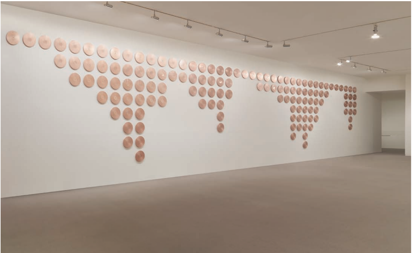
Sonny Assu, Ellipsis , 2012. Photo: Rachel Topham, Vancouver Art Gallery, © Sonny Assu permission de | courtesy of the artist & Equinox Gallery, Vancouver