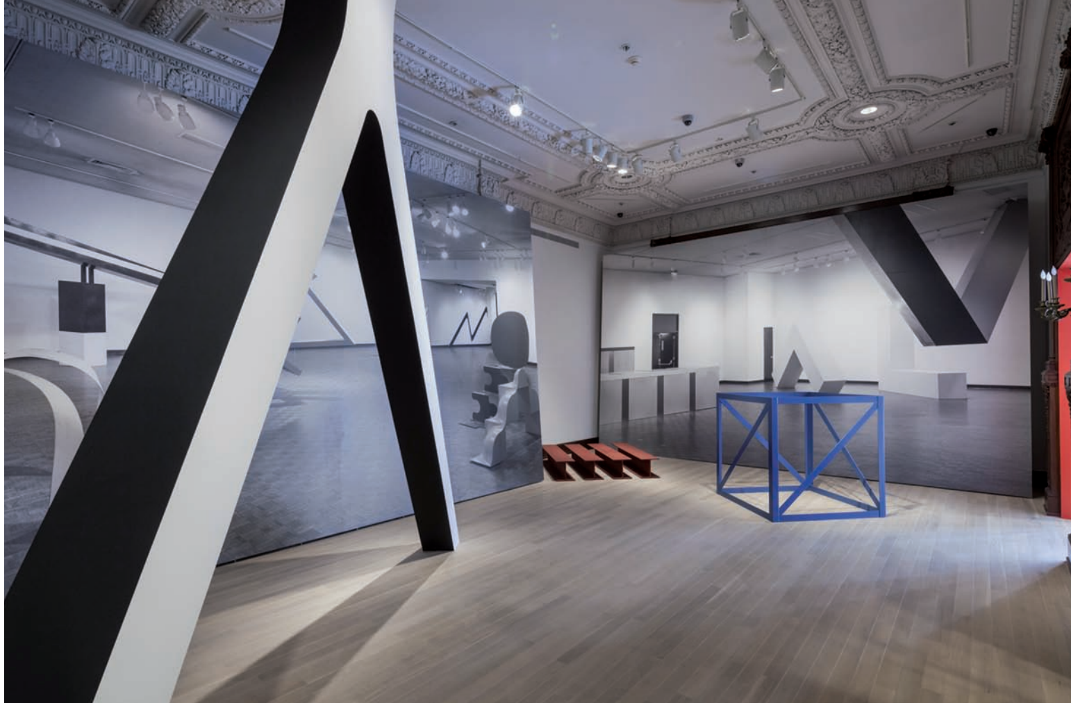
Other Primary Structures, Others 1, 2014, vues d'installation | installation views, The Jewish Museum, New York.