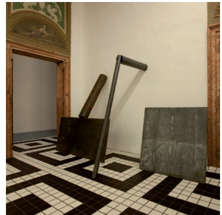
Other Primary Structures, Others 1 & 2, 2014, vues d'installation | installation views, The Jewish Museum, New York.