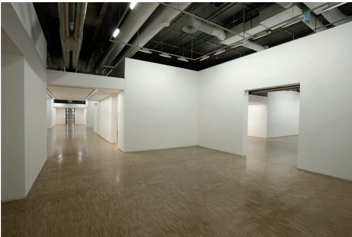
Vides. Une rétrospective , 2009, vues d'installation | installation views, Centre Georges-Pompidou, Paris.