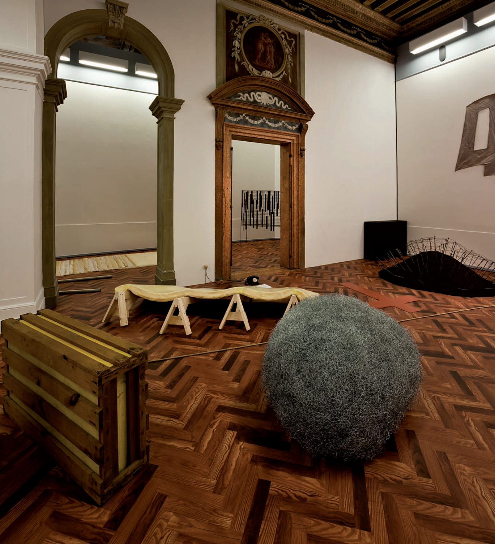
When Attitudes Become Form: Bern 1969/Venice 2013 , 2013, vue d'installation | installation view, Fondazione Prada, Venise.