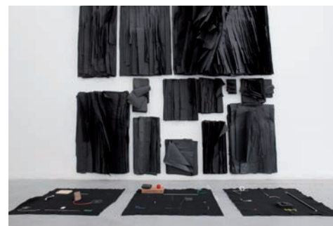
Quart d'heure américain , vues d'installation, Mains d'Œuvres, Saint-Ouen, 2017.