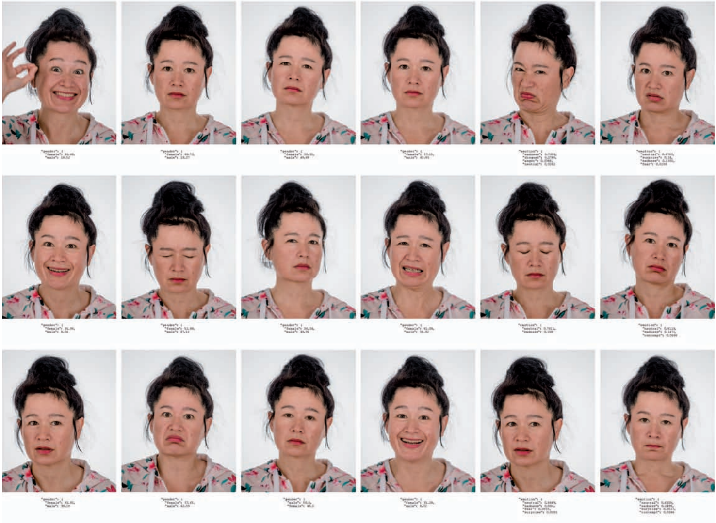
Trevor Paglen Machine Readable Hito , détail | détail, 2017.