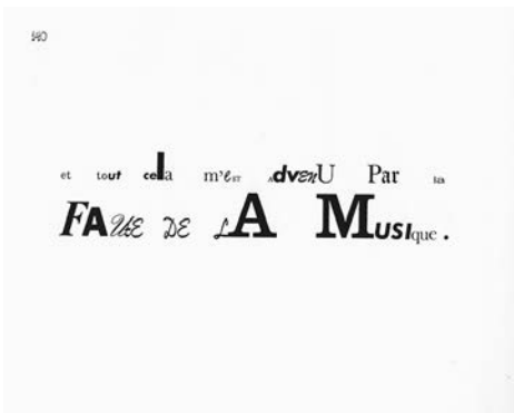
John Cage, Song Books , 1970.