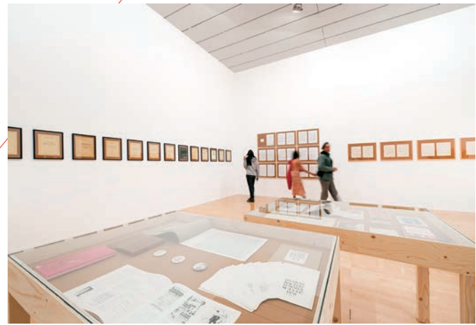
Vue d'exposition, Cage's Satie: Composition for Museum , Musée d'art contemporain, Lyon, 2012.