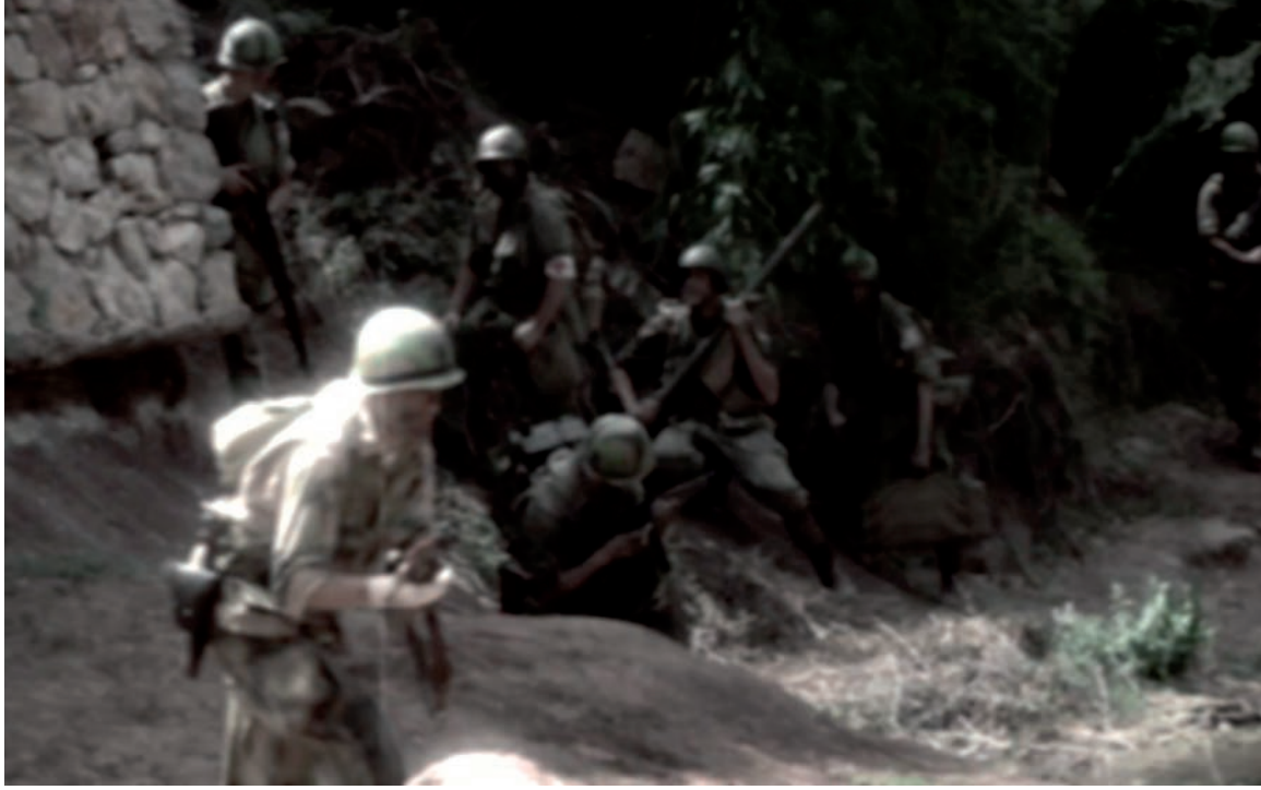
SANDY AMERIO, DRAGONED, CAPTURE VIDEO, 2012.