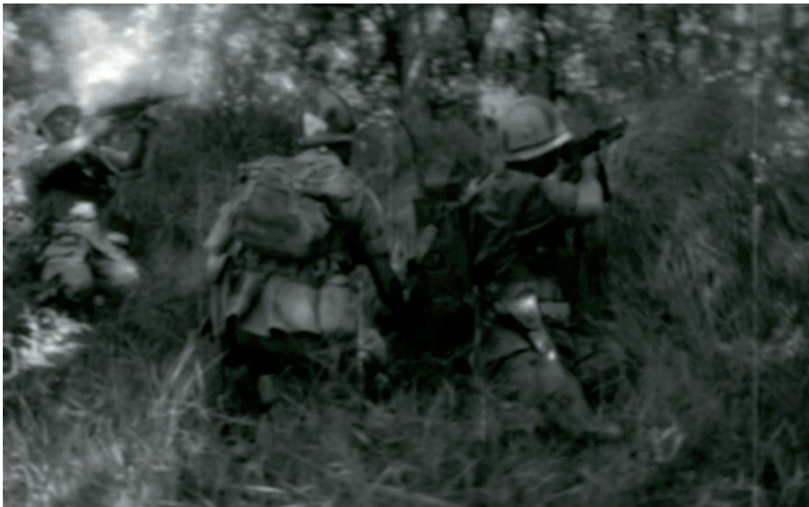
SANDY AMERIO, DRAGONED, VIDEOSTILL, 2012.