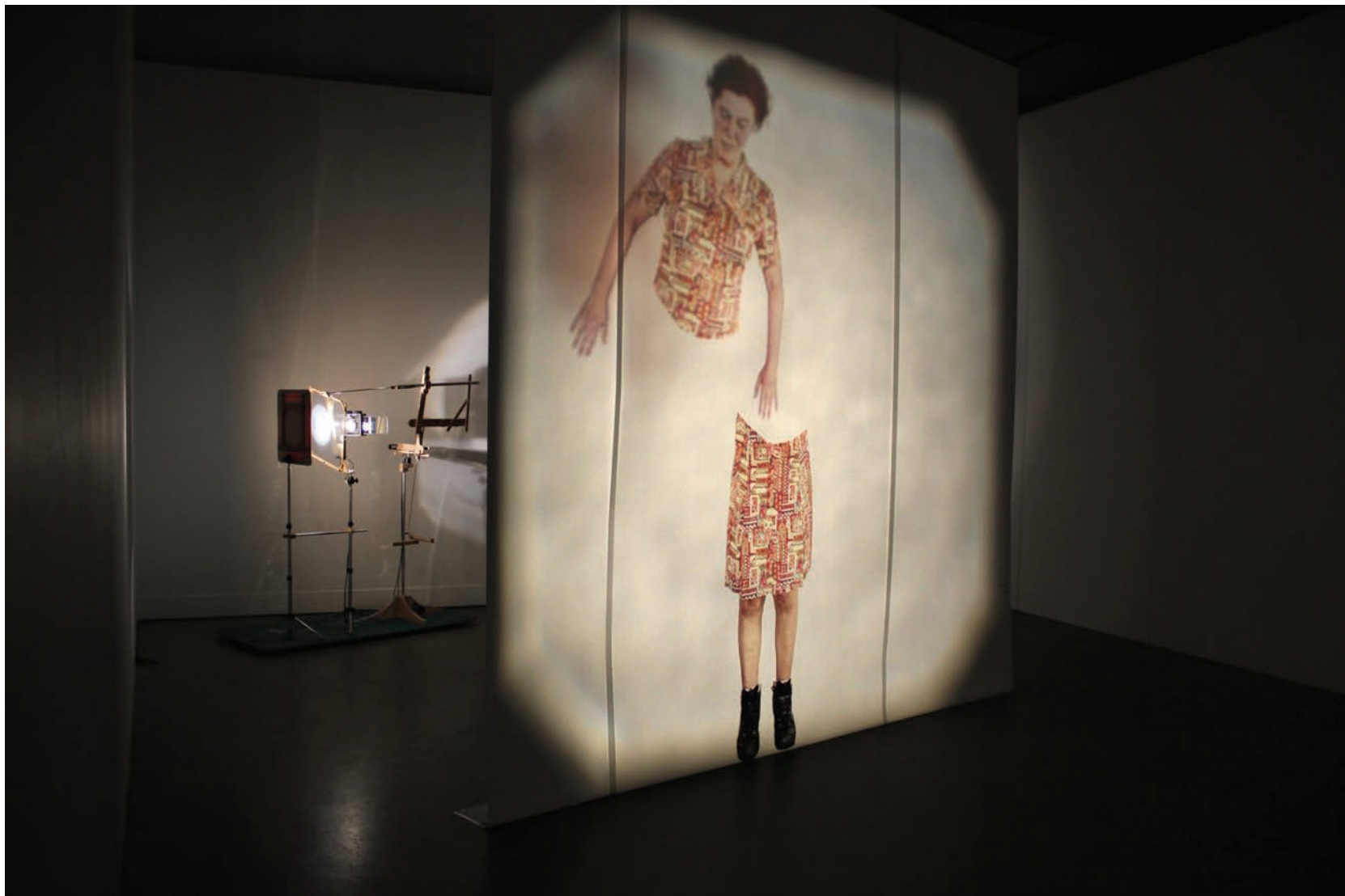
Manon Labrecque, Orbitale , 2012. Installation cinématique et sonore.

Capter le corps, son mouvement, son mécanisme, n'est pas chose simple. L'image non plus, au final, n'est pas chose simple; elle demande une panoplie bien plus apprêtée qu'on ne le supposait. Elle demande à être après bien des méandres. En plus, elle repose tout entière sur le flux lumineux et c'est celui-ci qui doit se lester d'appareils articulés et composés de miroirs dépolis, créant réflexions et réfractions. Car l'image en vient à être après être passée dans bien des sas. Ces interventions, certes, la composent. Mais le fait de voir aussi bien ces divers éléments la fragilise aussi du coup, et rend le spectateur conscient de tout ce dont elle dépend pour simplement être. Le visible est donc affaire de machines et de panoplies de vision. Il repose sur une machination dans laquelle