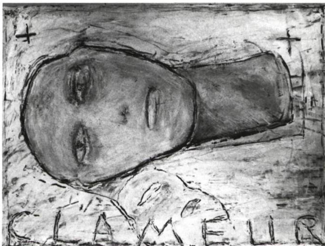
Michel Lagacé, Figure de mémoire, n° 5 , 1988, Acrylique sur papier, 57 x 76 cm