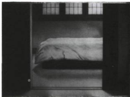
Micheline Pelletier, La chambre , 1987. Aquarelle; 78 x 96,5 cm