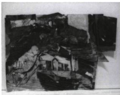
Seymour Segal, Intérieur , 1988. Acrylique et collage sur papier; 32 x 34 po