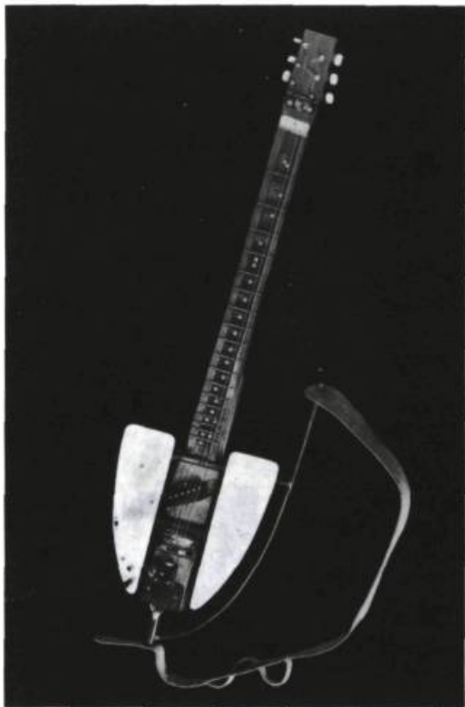
Murray Favro, Guitar , 1982. Bois, aluminium, acier et éléments de guitare; 325 cm x 1,135 m x 5 cm.

Entre 1964 et 1968, je bricolerai mon premier avion en commençant par esquisser un siège éjectable puis, en développant tout autour ce qui allait être l'engin. Un peu à la manière d'un dessin qui se définit