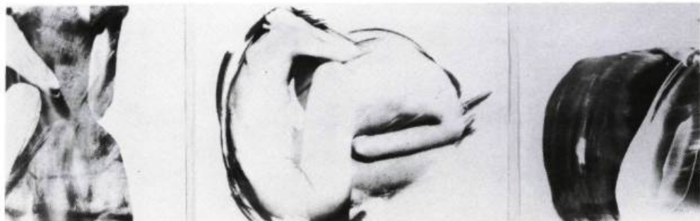
Ariane Thézé, L'Éternel Retour No 15, No 4, No 5, 1989. Cyanotype sur papier: 79 x 54 cm

Ariane Thézé, galerie Axe NEO-7, Hull, du 5 au 29 avril 1989 —