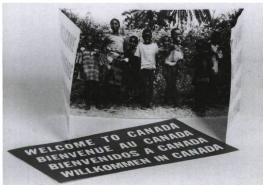
Alfredo Jaar, dépliant Fictions , 1989.

condensés, des fauteuils-télévisions, des banques de change miniatures, des chapelles de poche, etc. Ce néant est pourtant honnête; il est le lieu le plus compétent qui soit parce qu'il avertit de son incompétence, parce que c'est là que nous devons exister pour être ailleurs. Le pacte que nous faisons avec tous les aéroports du monde c'est celui de la raison d'être, pour partir ou arriver, pour se réfugier ou pour attendre, pour accueillir ou se séparer. Ainsi, il est rempli d'intentions (de bonnes) et formule l'anatomie même du néant où le monde n'existe que pour devenir.