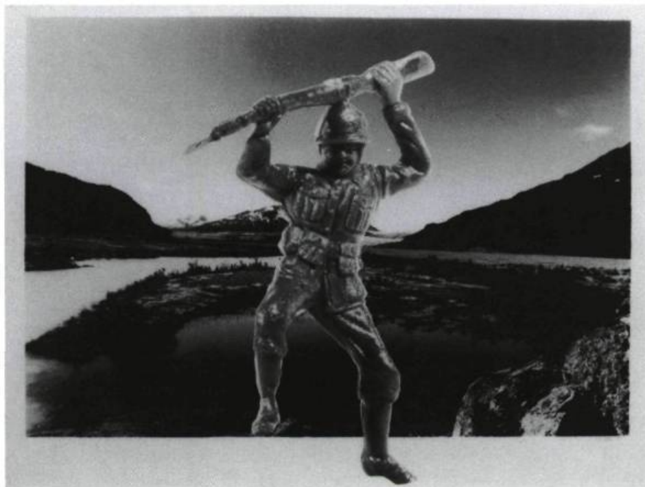
Suzy Lake, Exotic Glacial Trough , 1989. Photocollage (photo teintée, photo); 79 x 102 cm

Suzy Lake, galerie Daniel, Montréal, du 7 septembre au 23 septembre 1989 —